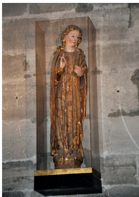
Fig. 1. Virgen de la Anunciación de Gamonal, Burgos

En este grupo, podemos observar a María girando su cuerpo hacia la izquierda, donde se sitúa el ángel, quien se vuelve hacia la derecha. La Virgen sujetaría el libro con la mano izquierda, con la derecha exterioriza la emoción que le produce la salutación angélica. Gabriel