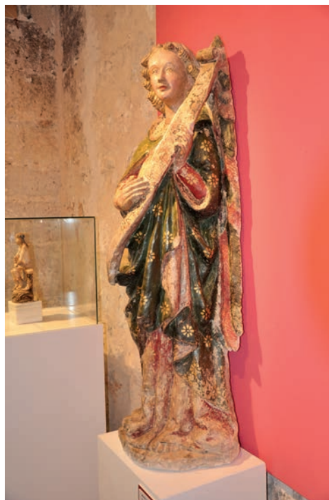
Fig. 4. Ángel de la Anunciación del monasterio de Madres Dominicas de Caleruega, Burgos

Las esculturas de la Anunciación (Figs. 4 y 5) proceden de la antigua iglesia conventual, que comenzó a construirse a partir de 1266. Son pocos los restos que se conservan de esta edificación, pero por su proximidad cronológica con las obras del claustro, ésta se debió realizar en un estilo románico tardío. La antigua advocación era de la Anunciata y las dos esculturas en estudio estuvieron situadas en su capilla mayor 74 . En la actualidad se custodian en el museo conventual.