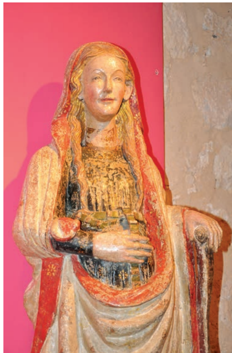
Fig. 5. Virgen de la Anunciación del monasterio de Madres Dominicas de Caleruega, Burgos