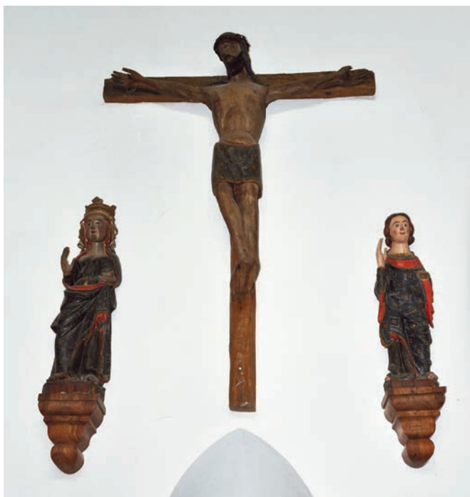
Fig. 3. Anunciación de La Ventosilla, Gumiel del Mercado, Burgos

La última talla de esta variante, la Virgen de Buezo, es la titular de la ermita de su nombre, que fue la antigua parroquial del despoblado de Buezo 70 . Perteneció al monasterio jerónimo de Espeja, situado en la provincia limítrofe de Soria 71 . Actualmente se enclava en el término de Hinojar del Rey. Al igual que La Ventosilla, Buezo pertenecía a la diócesis del Burgo de Osma.