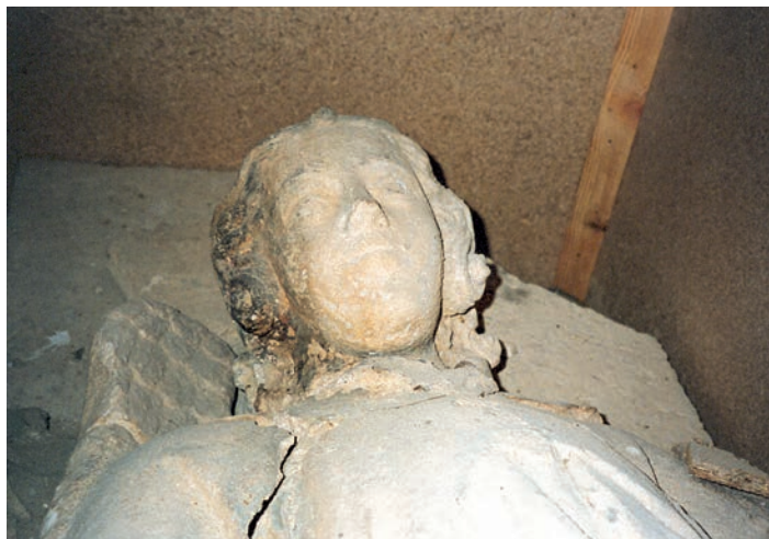
Fig. 7. Ángel de Sasamón antes de la restauración

burgalés. Alfonso VIII donó a la fábrica los tributos reales que allí se recaudaran. Fueron varios los monarcas que confirmaron este privilegio, hasta el siglo XVIII 76 . La primitiva edificación era tardorrománica y a ésta le sucedió en el siglo XIII una de traza protogótica, que puede identificarse con la parte más antigua de la iglesia actual, el hastial occidental y las naves. En la segunda mitad de la centuria se realizó la cabecera 77 .