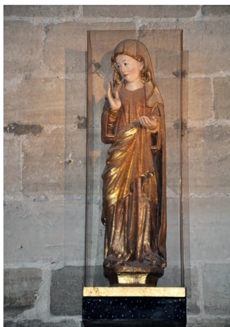
Fig. 2. Ángel de la Anunciación de Gamonal, Burgos