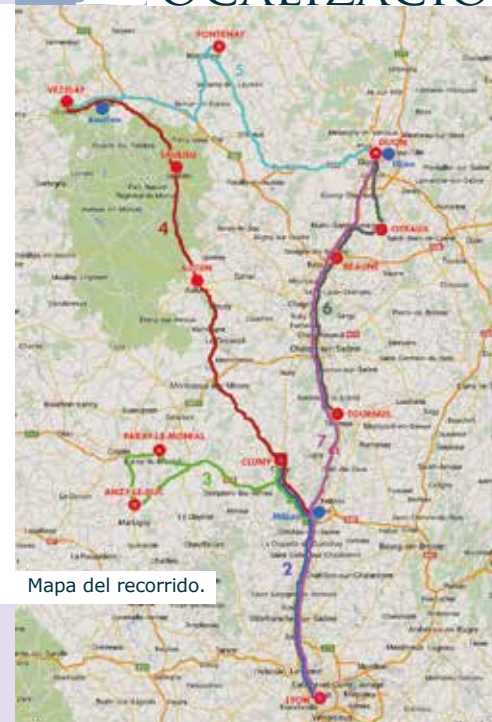
Mapa del recorrido.