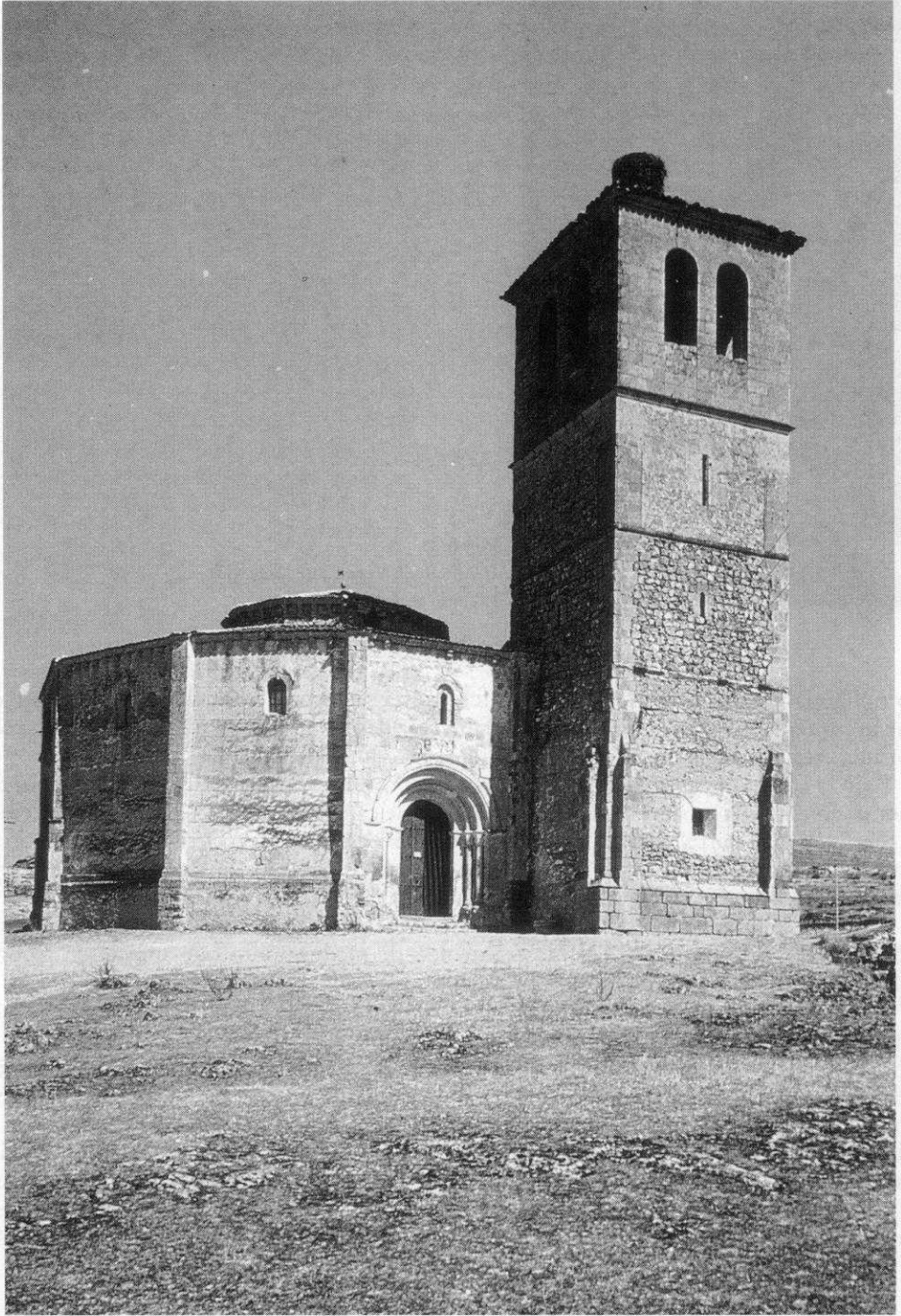
Fig. 5 Iglesia de la Vera Cruz (Segovia)