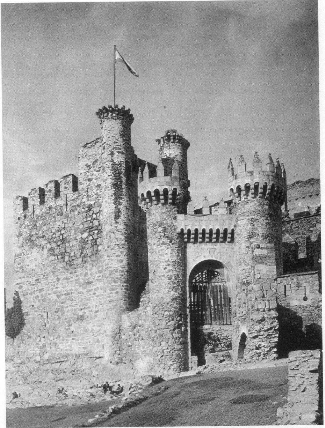
Fig. 1 Castillo de Ponferrada (León)