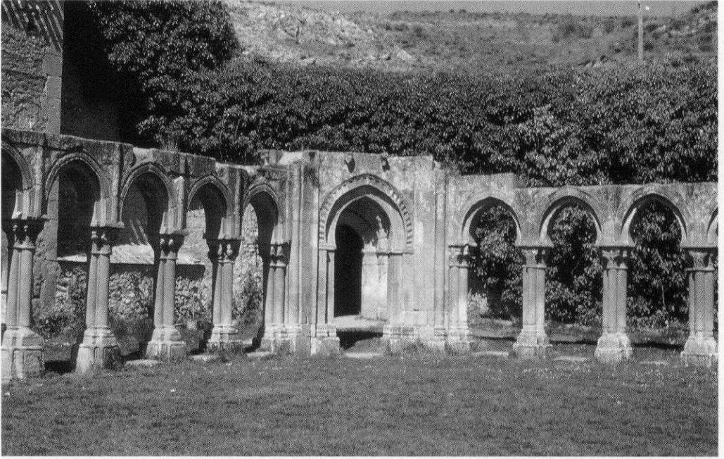
Fig. 2 Iglesia de San Juan de Duero (Soria)