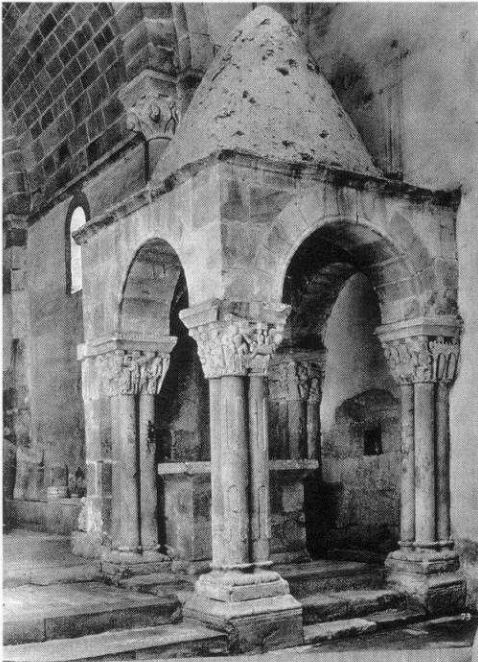
Fig. 3 Iglesia de San Juan de Duero (Soria). Uno de los baldaquinos