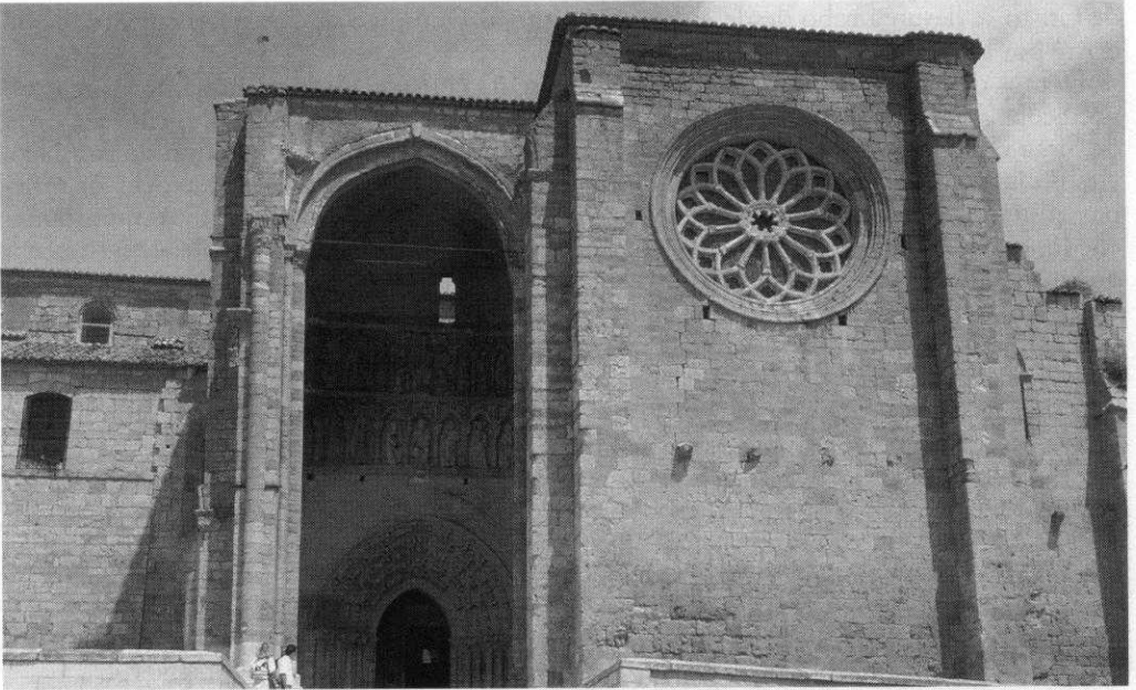
Fig. 7 Iglesia de Santa María la Blanca en Villalcázar de Sirga (Palencia). Fachada de Poniente