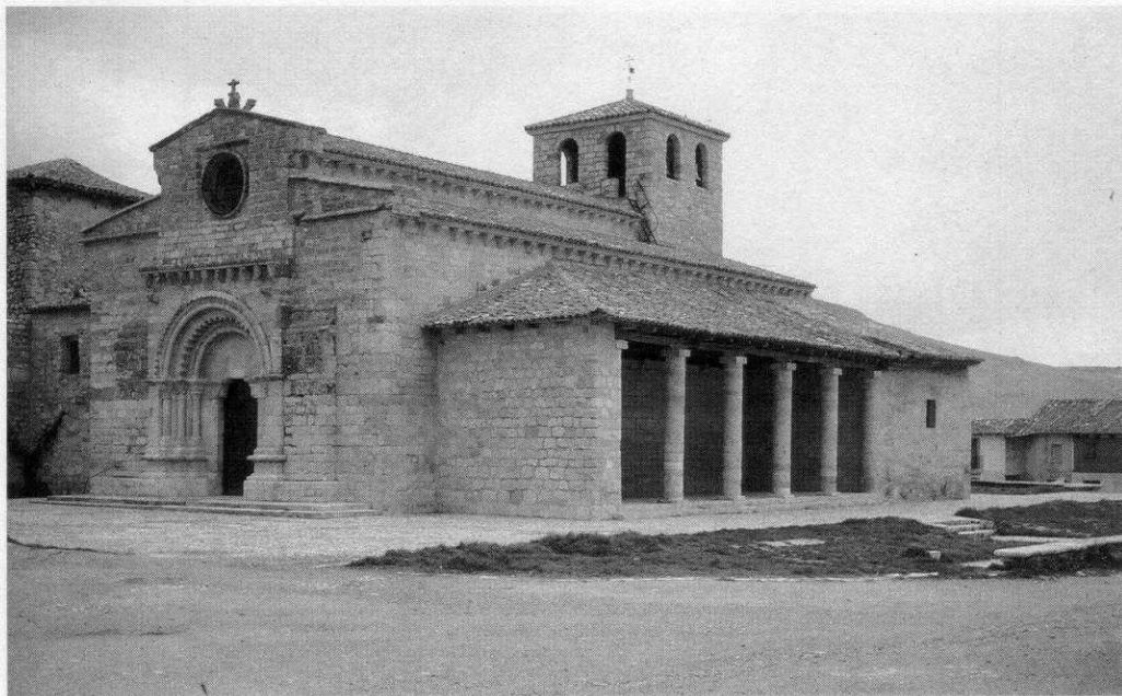
Fig. 4 Iglesia de Santa María de Wamba (Valladolid)

dad de su planta. Este edificio, junto con otras iglesias hispánicas y europeas sirvió para cimentar la teoría mantenida durante mucho tiempo de que la orden de los Templarios desarrolló un modelo propio de iglesia con planta centralizada. Estudios posteriores ya se han encargado de desmentirlo, explicando de forma satisfactoria tanto el origen como la función de un edificio como éste 16 .