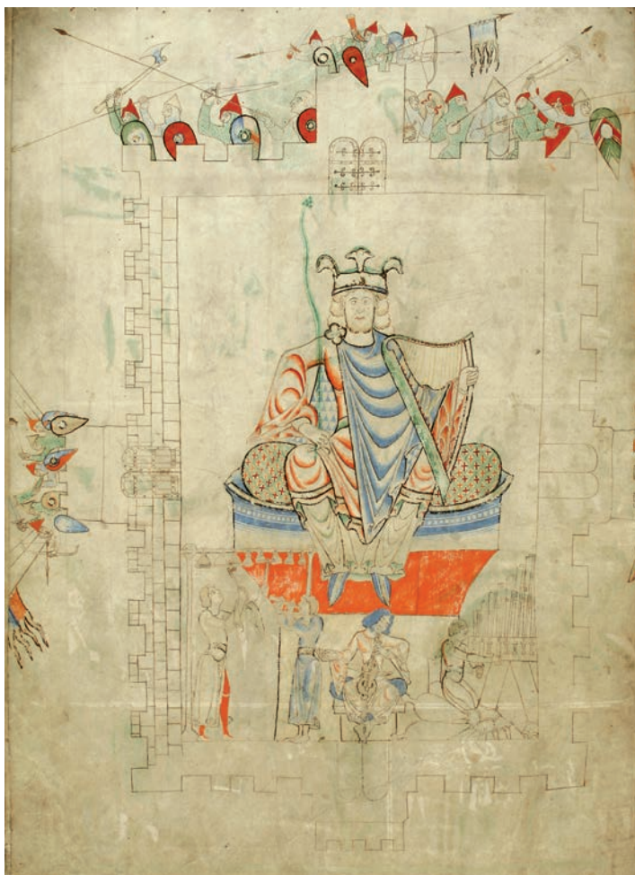
Fig. 3. Dijon, Bibliothèque Municipale, ms. 14, f. 13v

A differenza dell'immagine di Ester, la miniatura che precede l'inizio del libro dei Salmi (ms. 14, f. 13v, Fig. 3) non è narrativa e non illustra alcun episodio biblico in particolare: essa