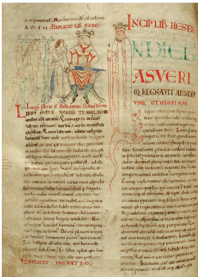
Fig. 1. Dijon, Bibliothèque Municipale, ms. 14, f. 122v

Come abbiamo già avuto modo di mostrare in altri studi sulla stessa immagine 13 , la miniatura della Bibbia di Cîteaux presenta diverse particolarità rispetto alle altre rappresentazioni medievali dello stesso episodio. In particolare, queste ultime raffigurano generalmente Ester in un atteggiamento di sottomissione al re, in modo da sottolinearne l'umiltà. Nella Bibbia di Stefano Harding, invece, il corpo della donna forma l'iniziale I ( In diebus ) della colonna destra del testo: dritta e imponente, Ester è dietro le spalle del re e osserva la scena trionfando su un drago. Anche l'immagine di Assuerus presenta un particolare insolito: egli non tiene lo scettro, elemento chiave del racconto biblico presente in tutte le rappresentazioni medievali di questo re, ma una spada.