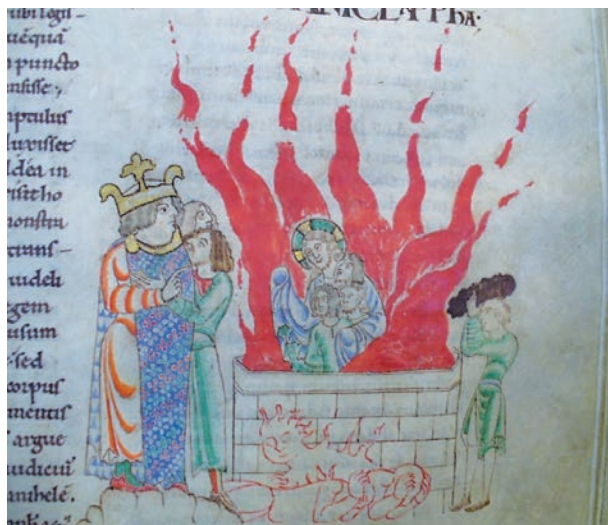
Fig. 8. Dijon, Bibliothèque Municipale, ms. 14, f. 64

La visione della fornace in questa immagine acquista una tonalità anagogica: Cristo che, al posto dell'angelo del Signore, prende tra le braccia i tre fanciulli Ebrei richiama infatti potentemente le rappresentazioni del seno di Abramo, figura del paradiso 40 . Del resto, anche il tema dei fanciulli salvati nella fornace è tradizionalmente una prefigurazione della salvezza dell'anima 41 . Il creatore delle immagini ha saputo dunque fondere le due formule iconografiche per comporre una sapiente rappresentazione che evoca il Paradiso e gli eletti. In questo contesto, appare chiaro che la personificazione del fuoco che brucia i servitori del re o i Caldei, in primo piano nell'immagine, mostra per contrasto la sorte che attende i dannati. La miniatura rappresenta dunque una vera e propria visione dell'aldilà, con il paradiso e l'inferno, a partire dal racconto biblico dei tre ebrei nella fornace, offrendo un'interpretazione anagogica di questo episodio.