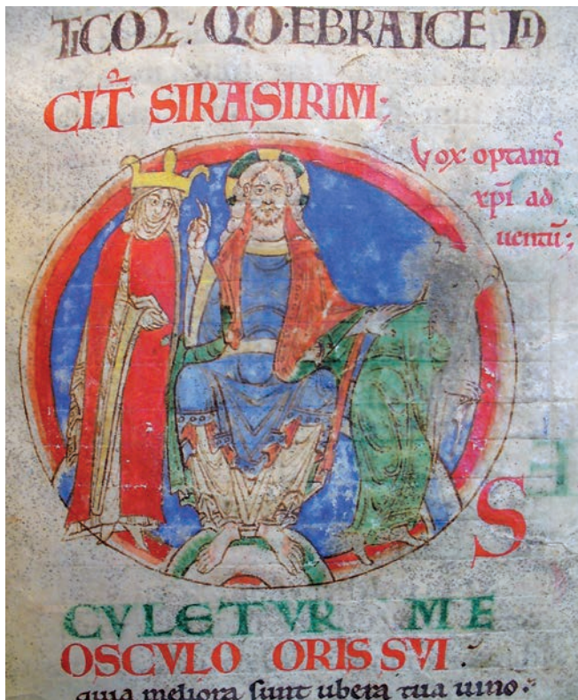
Fig. 2. Dijon, Bibliothèque Municipale, ms. 14, f. 60r

La lettura tipologica può essere applicata a tutta l'immagine, che si rivela così una visione sintetica dei rapporti tra la Chiesa e il potere spirituale. Il ruolo dell'instituzione ecclesiastica ne risulta esaltato, a scapito del potere temporale. In questo contesto l'inserimento nella miniatura