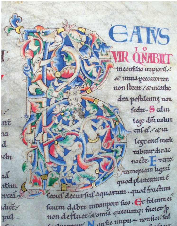
Fig. 7. Dijon, Bibliothèque Municipale, ms. 14, f. 14

L'individuazione di immagini che possano essere interpretate secondo un senso anagogico è meno scontata. In generale possiamo osservare che alcune immagini medievali erano considerate, in alcuni casi, come oggetti capaci di suscitare il transitus dall'esperienza terrestre a quella divina: esse possono dunque essere ritenute anagogiche per l'azione che esse esercitano sull'osservatore 36 . Nell'alto Medioevo, preoccupati di incorrere nell'accusa di iconodulia, gli autori occidentali negavano tale proprietà alle immagini. E' soltanto a partire dall'inizio dell'XI secolo che essi cominciano a riconoscere ad alcuni temi iconografici un'influenza sull'osservatore. Secondo Gerardo di Cambrai, il crocifisso avrebbe così il potere di imprimersi