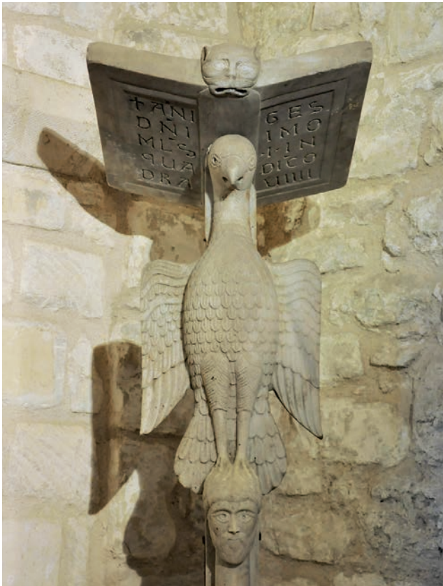
Fig. 6. Monte Sant'Angelo (FG, Italie), Museo lapidario e museo devozionale del Santuario di San Michele, lettore di pulpito dello scultore Acceptus (1041)

In definitiva, le tre miniature analizzate illustrano alcuni dei processi di creazione iconografica delle miniature della Bibbia di Stefano Harding. Vere e proprie opere esegetiche, le immagini assegnano una molteplicità di significati al testo biblico. Proprio come i commentari biblici medievali, esse invitano a oltrepassare il livello letterale, provocano la diffrazione 32 di senso di un episodio e invitano l'osservatore a penetrare intellettualmente le scene rappresentate. E' quindi naturale chiedersi se le immagini possano fornire delle interpretazioni secondo i quattro sensi della Scrittura, quali essi erano teorizzati dagli autori medievali.