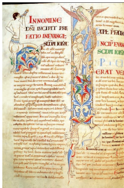
Fig. 5. Dijon, Bibliothèque Municipale, ms. 15, f. 56v

La miniatura non si limita tuttavia a combinare fonti di ispirazione tratte dai testi, ma utilizza un linguaggio e un vocabolario figurativo. Il significato della miniatura è espresso attraverso