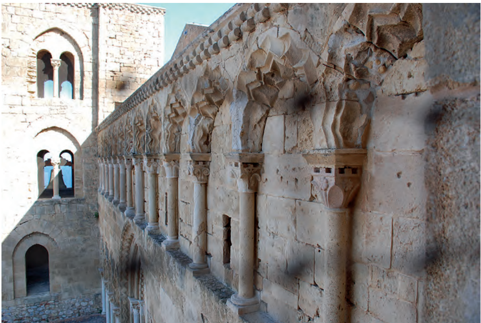
Fig. 3b y 3c. Catedral de Cefalù. Sicilia. Siglo XII (© Juan Carlos Ruiz Souza)