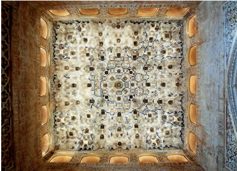
Fig.4a. Granada. La Alhambra. Cúpula de mocárabes en la Sala de los Reyes del Palacio de los Leones. Segunda mitad del siglo XIV