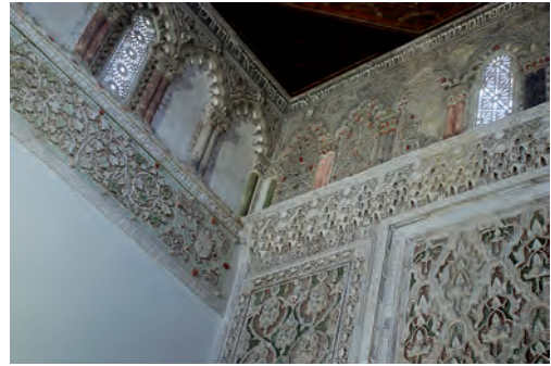
Fig. 6b. Sinagoga del Tránsito, Toledo, 1361, detalle (© Juan Carlos Ruiz Souza)

y Toledo. 51 La reina Isabel la Católica tras morir en 1504 en Medina del Campo (Valladolid) fue trasladada al convento de San Francisco de la Alhambra por ella fundado en 1495. Su cuerpo fue enterrado bajo una cúpula de mocárabes nazarí del siglo xiv. Se reproducía así en la Corona de Castilla una práctica musulmana habitual. Aún se conserva en la catedral de Palermo una cúpula de mocárabes en el ábside meridional de su cabecera, en lo que parece pudo ser un arcosolio funerario.