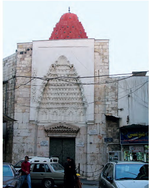
Fig. 1. Damasco. Maristán. Siglo XII

El maristán de Damasco del siglo XII (Fig. 1) cuenta con un cuerpo de entrada donde los mocárabes alcanzan un gran protagonismo tanto en la fachada como en la estancia interior que existe tras ella, donde se eleva una gran cúpula que des-