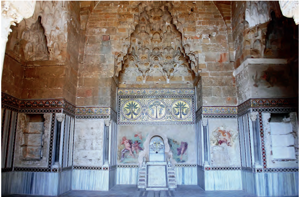
Fig. 2. Palermo. La Zisa. Sala della Fontana. Siglo XII

en la misma sala della fontana y en otras partes del mismo edificio en las plantas altas. Restos de otras cúpulas nos han llegado en el palacio de la Cuba y en el de Uscibene de la misma ciudad e igualmente aparecen en ámbitos religiosos palermitanos: Capella Palatina, Capella de la Santísima Trinità, catedral, etc.