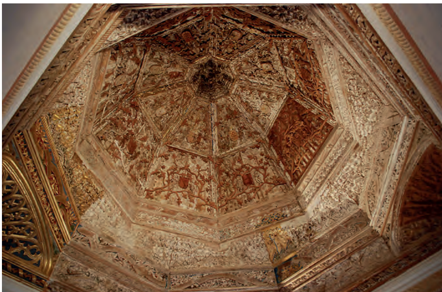
Fig. 10. Palacio de Belmonte. Mediados del siglo xv

espacio natural y fantástico-literario, el salón de virtud del marqués de Villena. En un contexto similar deberían comprenderse los salones del palacio del Infantado de Guadalajara de finales del siglo xv, caso de la quadra de mocárabes y del Salón de Linajes entre otros, donde parece que se jugaba con la historia y el mundo literario. Desgraciadamente su desaparición hace que no conservemos el recinto palatino con los espacios más especializados en su función de todo el panorama castellano, que sería acorde a la formación de sus promotores. 70