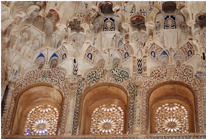
Fig.4b. Granada. La Alhambra. Sala de los Reyes del Palacio de los Leones. Detalle del agua y del jardín. Segunda mitad del siglo XIV

ahora sí de forma real, surge del suelo mediante surtidores en las salas de Dos Hermanas y de Abencerrajes y, en las galerías este y oeste del patio. A través de cuatro canales orientados a los cuatro puntos cardinales llega el agua a la célebre fuente donde se renueva continuamente al salir de las fauces de los doce leones. Bajo las decoraciones vegetales de las bases de las cúpulas y de los arcos se inicia una compleja decoración geométrica que culmina en los zócalos conservados. Las estructuras geométricas que presentan los zócalos cerámicos del palacio no son