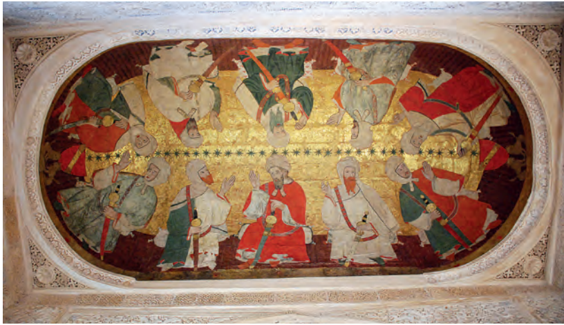
Fig. 5. Palacio de los Leones de la Alhambra. Muhammad V con sus sabios. Segunda mitad del siglo XIV

la Creación de Dios, en perfecta armonía. Ya aludimos al carácter funerario de la sala de Aben-cerrajes del Palacio de los Leones al estudiarla en el contexto de la arquitectura islámica, y en especial al compararla con los ejemplos del Cairo mameluco. 43 Tras dicha sala se halla la rawdā , o jardín funerario donde se dispusieron las tumbas de los sultanes nazaríes.