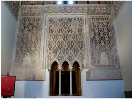
Fig. 6a Sinagoga del Tránsito, Toledo, 1361