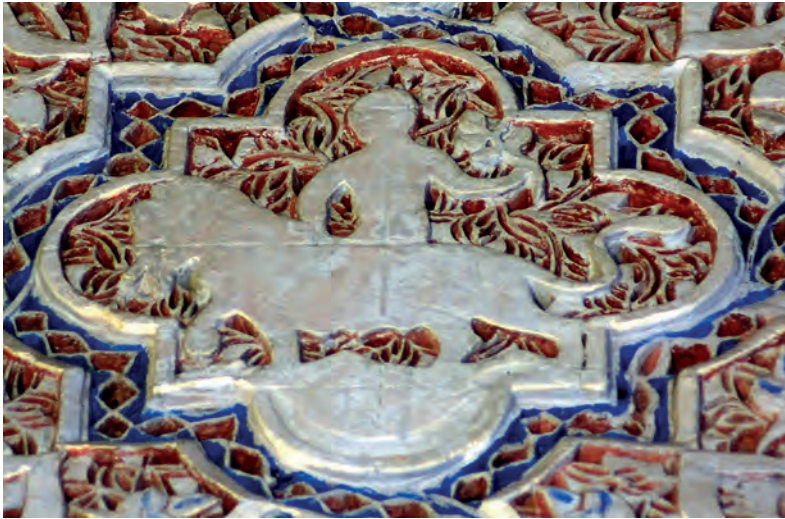
Fig. 9. Salón de Embajadores. Medallón con leona. siglo XIV-XV