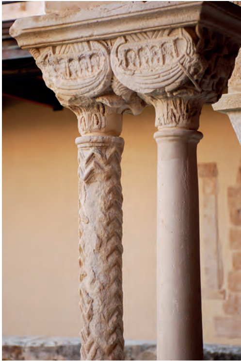
Fig. 3a. Catedral de Cefalú, claustro, capitel del Arca de Noé, siglo XII

la Creación: mocárabes y agua. De nuevo observamos códigos visuales perfectamente comprensibles en el pasado, aunque hoy nos cueste reconocerlos (Figs. 3 a, b, c).