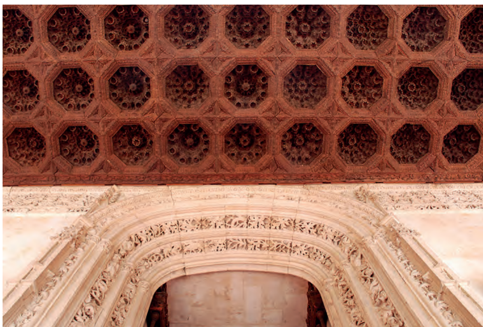
Fig. 12b. Salamanca. Entrada de la biblioteca de las Escuelas Mayores. Primer tercio del siglo xvi