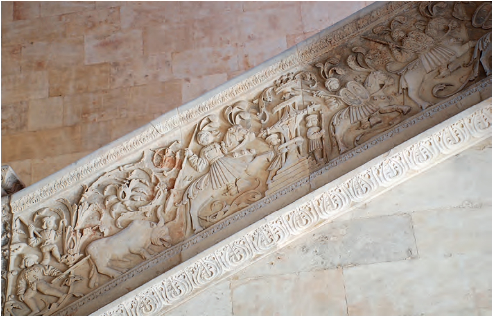
Fig. 11. Salamanca. Escalera de subida a la biblioteca. Escuelas Mayores. Primer tercio del siglo XVI

de la decoración que se desarrolla por todo el edificio (rampa de acceso al claustro, frisos decorativos, antepechos de las arquerías, etc.). Especial mención merece la disposición de relieves decorativos, en los dos pisos, con jeroglíficos procedentes de entre otras fuentes de la Hypnerotomachia Poliphili de Francesco Colonna, publicado en Venecia en 1499. Libro y jeroglíficos que gozaron de gran fama en Europa, al convertirse en un tratado de virtudes en donde de nuevo la sabiduría es el objetivo a alcanzar. 80 Jeroglíficos que el lector descifrará con no poco esfuerzo al tener que enlazar aspectos mnemotécnicos, morales y lingüísticos que tanto éxito tuvieron en la retórica clásica. 81