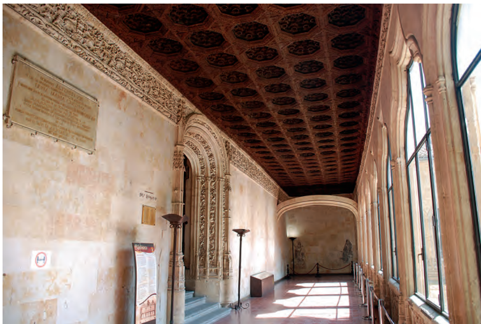
Fig. 12a. Salamanca. Escuelas Mayores. Galería pórtico de la biblioteca. Primer tercio del siglo xvi