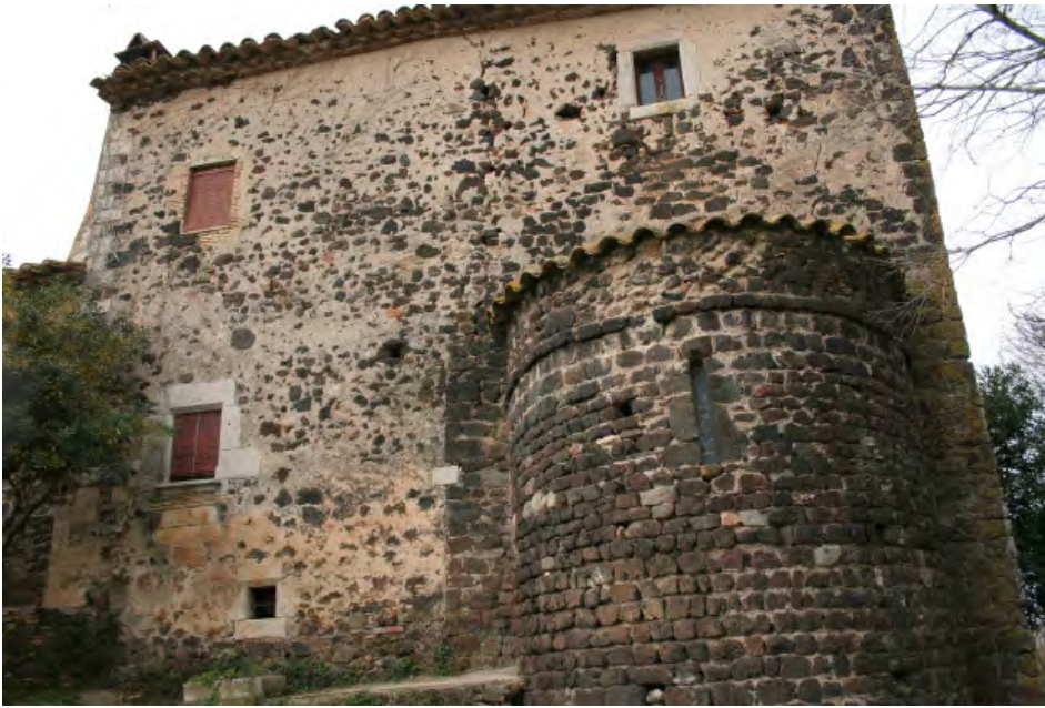
Ábside de la capilla