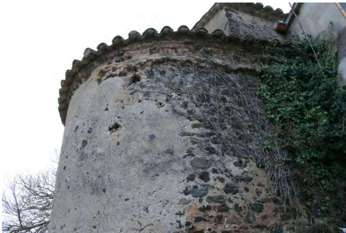
Detalle del ábside

donde más tarde se construiría, dentro del recinto fortificado, la capilla de Sant Jaume.