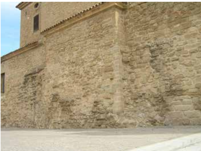
Resto del muro exterior