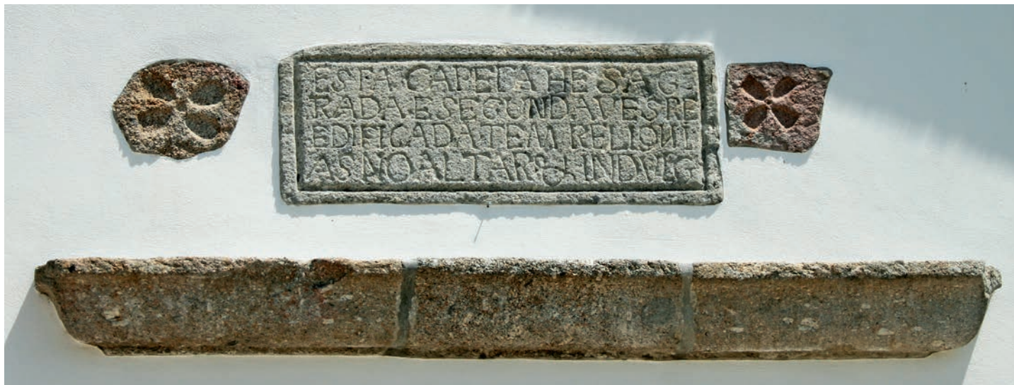
Capela de Santa Luzia, que pertenceu ao Solar. Cruzes de sacração românicas e, ao centro, inscrição da reconstrução moderna do templo