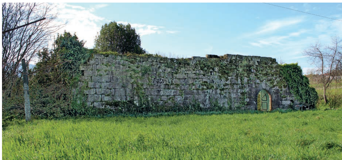
Vista geral da fachada principal da torre e anexo residencial