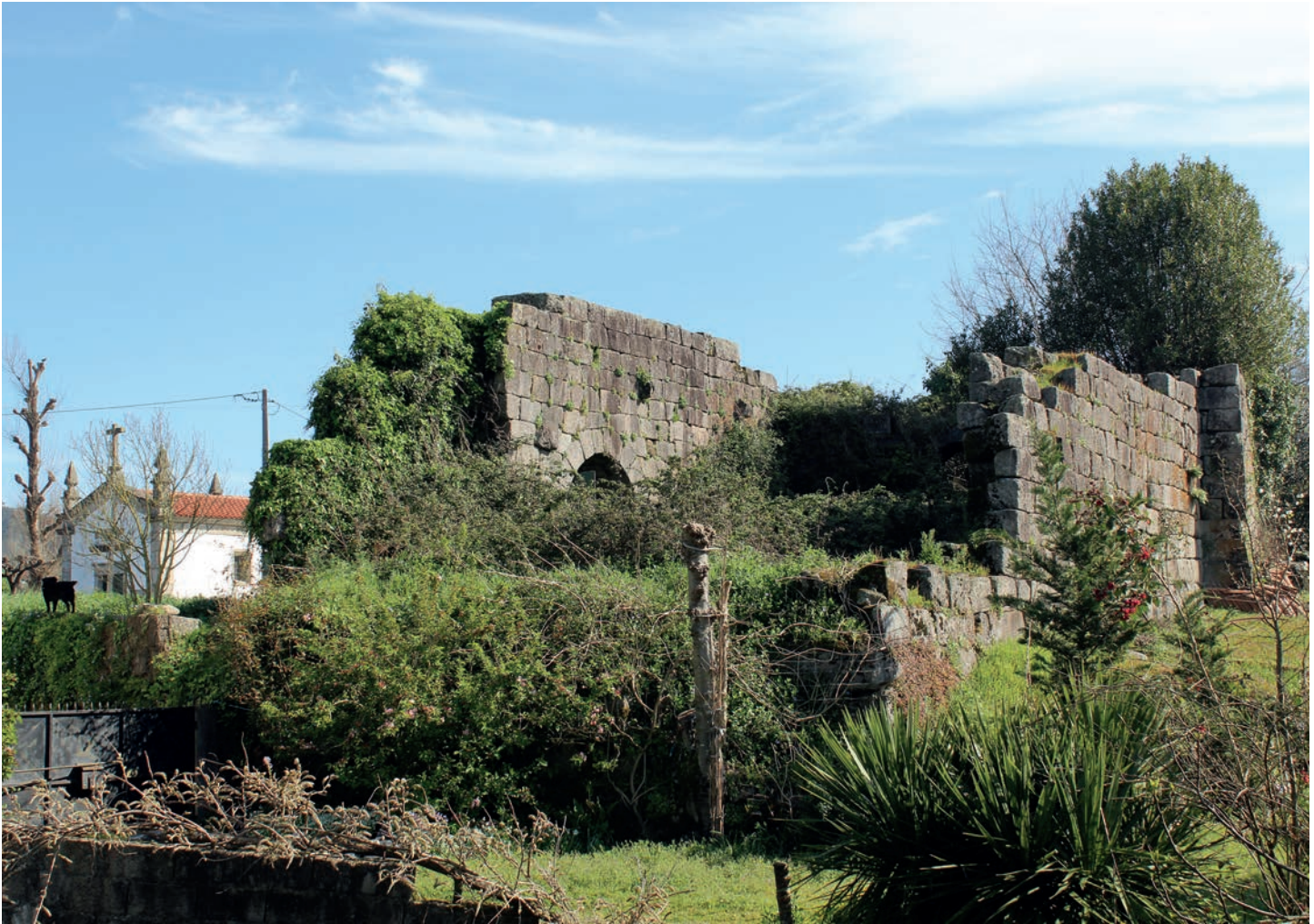
Vista geral de sul, vendo-se o ressalto na separação entre a zona do anexo residencial e a torre senhorial