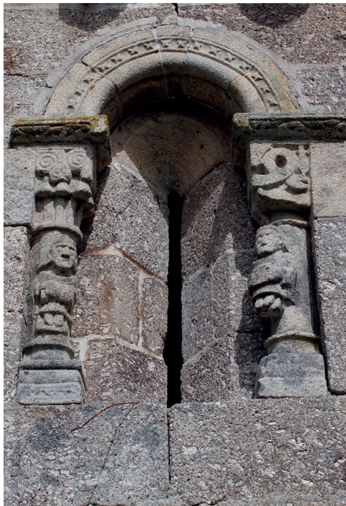
Fresta da fachada sul da igreja

conjuga elementos fitomórficos com duas aves afrontadas na esquina do cesto.