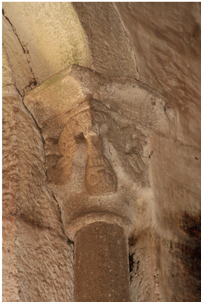
Interior da igreja. Capitel da fresta da fachada sul da nave

No entanto, a forma dos cestos e a escultura dos capitéis da fresta da fachada sul, tanto no seu arranjo interno como externo, segue modelos difundidos já nas primeiras décadas do século XII. A epígrafe datada de 1180, gravada no tímpano do portal ocidental que, segundo Mário Barroca, deverá comemorar a dedicação do templo, muito embora seja de referir que C. A. Ferreira de Almeida a considera paleograficamente posterior, e as serpentes grafiticamente gravadas no portal sul, semelhantes às do portal ocidental da igreja de Sanfins de Friestas (Valença), construção datável dos meados do século XII, sugerem uma datação mais precoce. Todavia, a capela, quando apreciada no seu conjunto, não parece ser consentânea com uma cronologia tão recuada. A ausência do arco triunfal românico torna ainda mais complexo o exercício de determinar o ritmo construtivo deste templo, já que a comparação com monumentos similares da Ribeira Lima fica assim desprovida de uma parcela fundamental para uma aferição cronológica mais precisa.