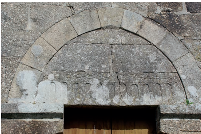
Tímpano do portal sul da igreja