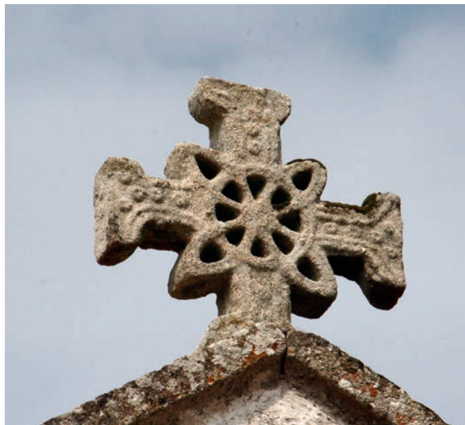
Cruz da empena no lado oriental da nave da igreja

de Távora destina-se a levantar hipóteses e a sublinhar a dificuldade em estabelecer cronologias quando abordamos o românico do Entre-Douro-e-Minho.