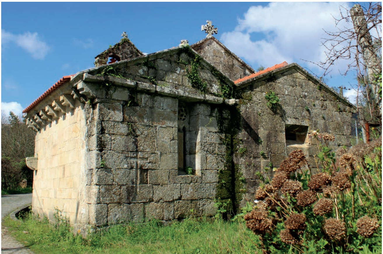
Vista geral da igreja a partir de este