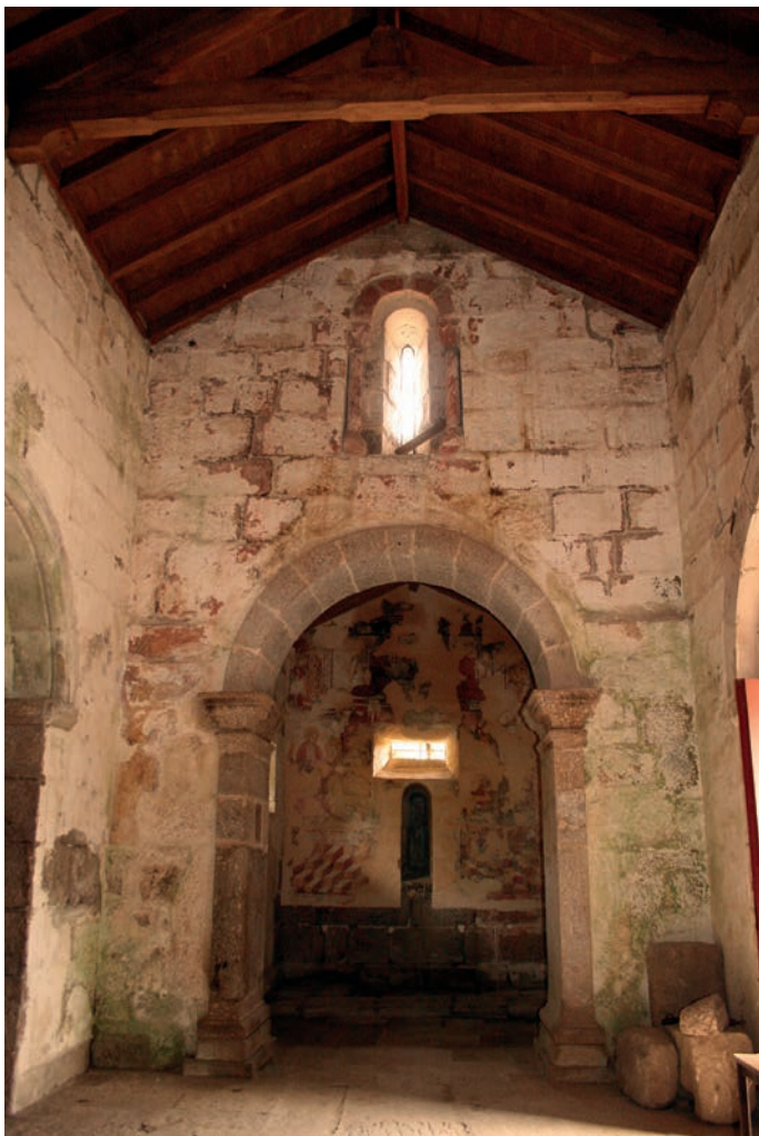
Interior da igreja. Perspetiva da cabeceira