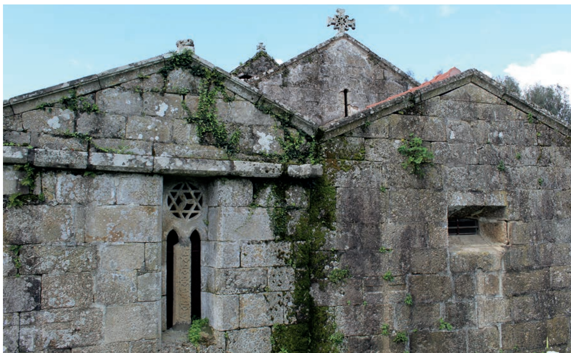
Fachadas orientais da cabeceira da igreja e da capela de São Tomé

No interior, pouco mais resta da igreja medieval do que os muros, a fresta que se abre na parede sul, e a fresta que está sobre o arco triunfal, uma vez que este arco corresponde a uma obra muito posterior. Segundo o relato de Félix Alves Pereira o arco foi reconstruído entre o final do século XIX e o início do século XX. A fresta do muro sul apresenta colunas, um capitel vegetalista e um outro que