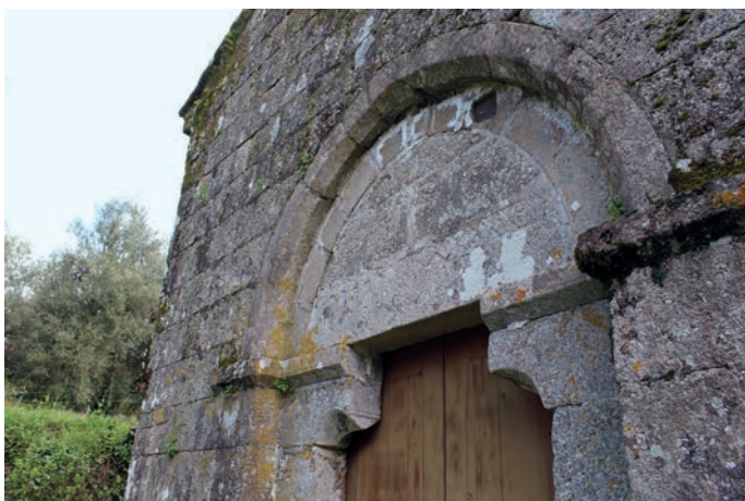
Portal ocidental da igreja