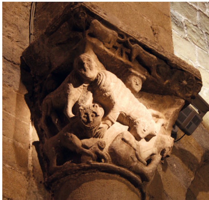
Sant Esteve d'en Bas. Capitel·l de l'interior de l'església. Primera meitat del segle XI?

(a la Garrotxa). Tota aquesta escultura està en procés d'estudi, de manera que és prematur aventurar una cronologia o una altra. Tot i així, podríem aventurar que es tractés d'una altra manifestació prematura, potser una mica anterior o paral·lela a les primeres rosselloneses i ripolleses, centrada a l'entorn de Girona, que no va tenir continuïtat.