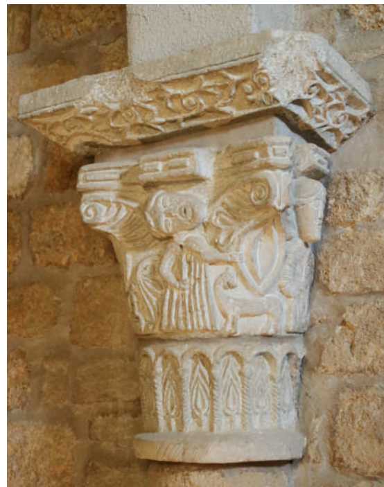
Sant Miquel de Fluvià. Capitell de l'interior de l'església. Segona meitat del segle XI?