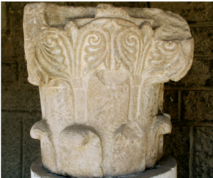
Santa Maria de Ripoll. Capitell. Primer terç del segle XI