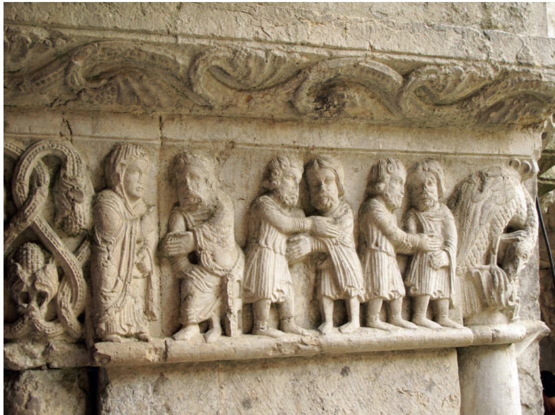
Catedral de Santa Maria de Girona. Relleu historiat del claustre.