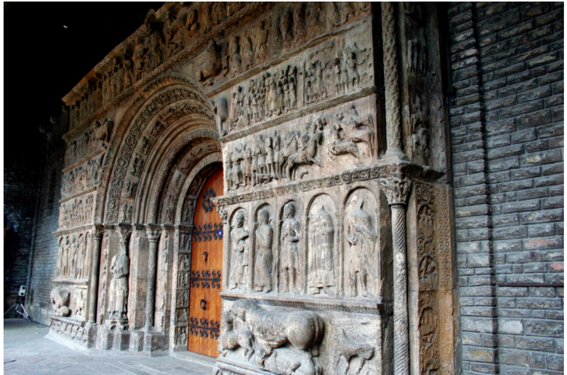
Santa Maria de Ripoll. Visió general de la portalada (ca. 1134-1151), anterior a la restauració del 2016