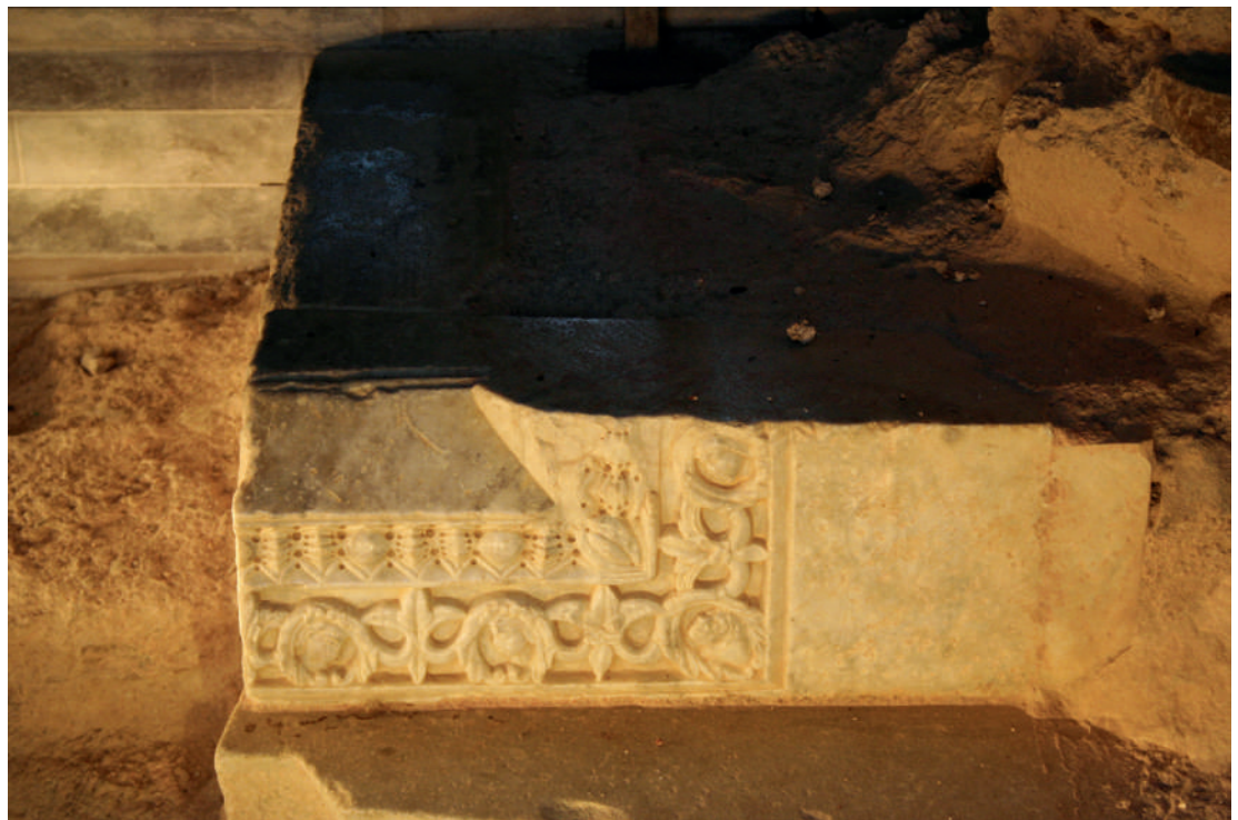
Sant Pere de Rodes. Vestigis de la portada del segle XII in situ.