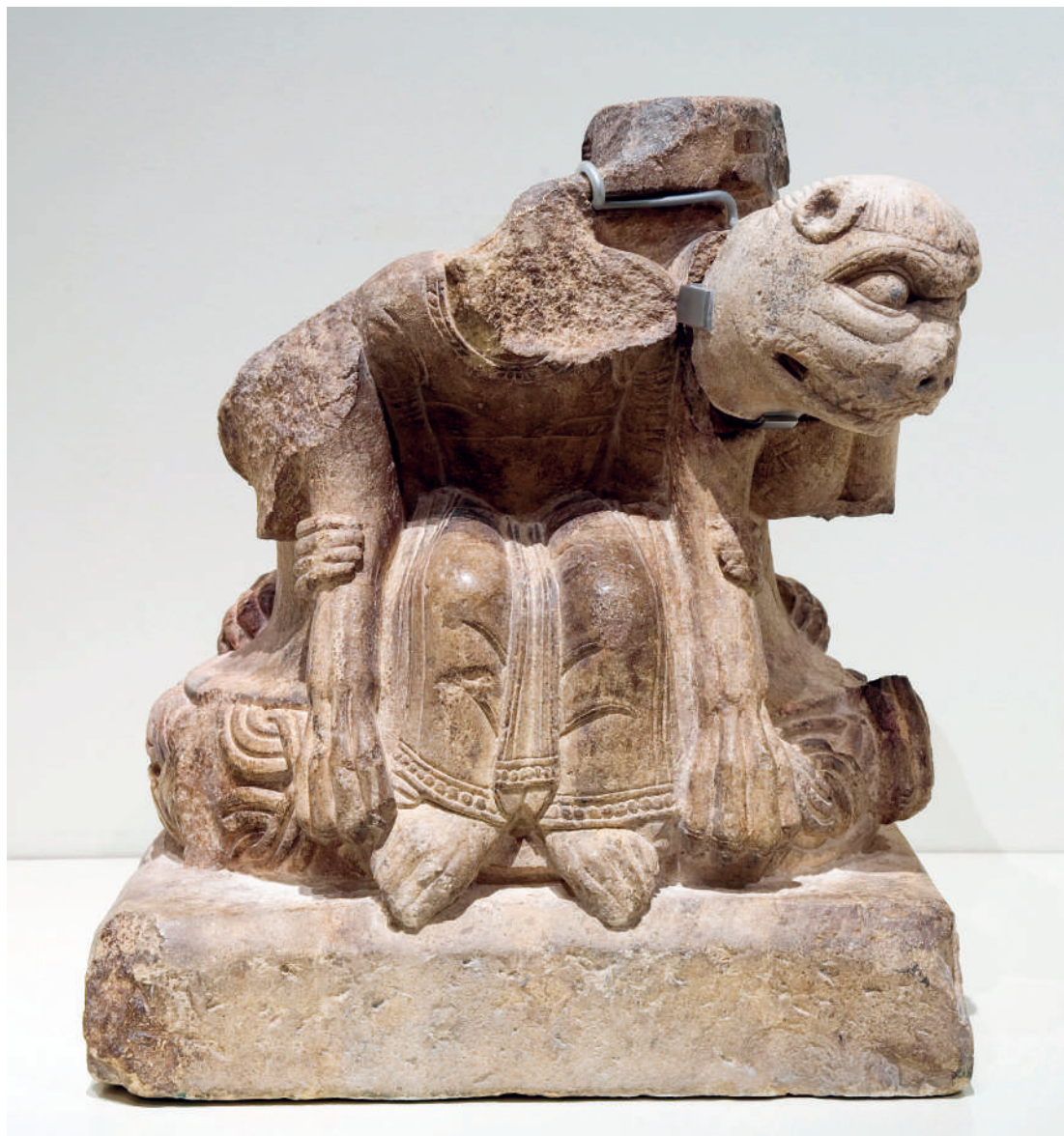
Suposada base del baldaquí de Ripoll (Museu Nacional d'Art de Catalunya, MNAC 214983, dipòsit del bisbat de Vic, 2011).

En proximitat amb aquestes dates devia iniciar-se la remodelació del claustre i les seves galeries, arrencant amb l'adossada a l'església monàstica. La selecció de les imatges manté el caràcter dels conjunts rossellonesos, en la mesura en què no es recorre a la temàtica historiada. Tradicionalment havia estat datat en l'època de l'abat Ramon de Berga (1172-1205), la qual cosa implicava un moment una mica tardà, una cronologia coincident amb la d'un altre conjunt paral·lel, l'ala meridional del claustre de la catedral d'Elna 20 . Novament aquí veiem els contactes amb l'escultura rossellonesa, que a la zona del Ripollès ofereix altres exemples destacables, com els capitells de Sant Pere de Camprodon, treballats en marbre. De totes maneres, la comparació directa amb el baldaquí reforça la hipòtesi que situava el conjunt en dates més properes a la mateixa portada, més