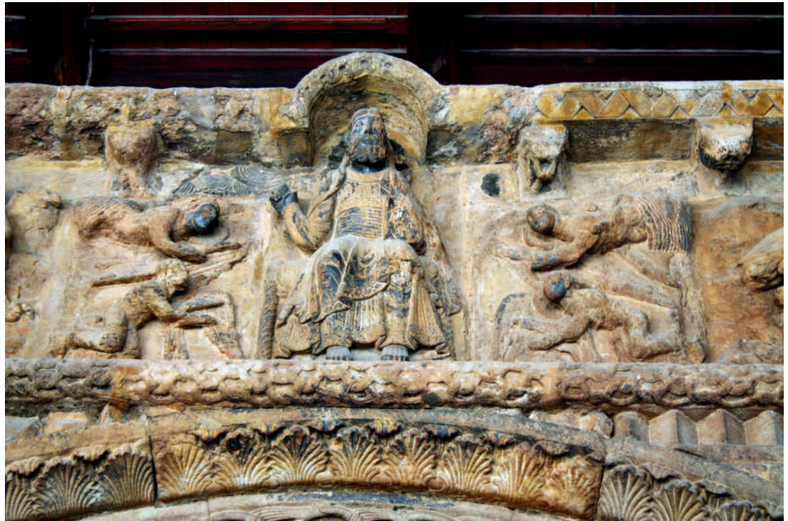
Santa Maria de Ripoll. Detall de la portada (ca. 1134-1151).