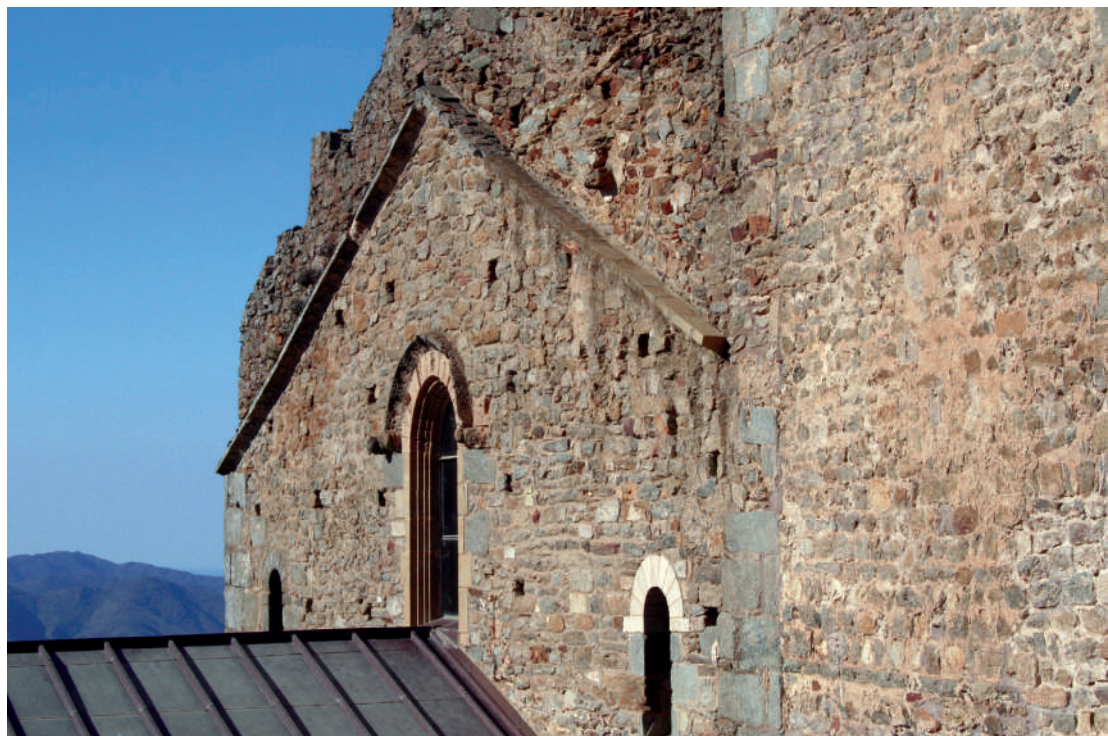
Sant Pere de Rodes. Imatge general de la façana del segle XI.

No obstant això, en aquest context sobresurt el conjunt de l'església monàstica de Sant Pere de Rodes, des de la decoració sistematitzada de l'interior fins al que queda de la façana occidental. Pel que fa a la decoració dels capitells de les columnes corresponents als pilars de l'interior, la cultura altmedieval de l'entrellaçat es combina sistemàticament amb el tema del capitell corinti, en concordància amb un alçat amb clars referents antics. Fora d'aquests casos, hi ha pocs exemples en què