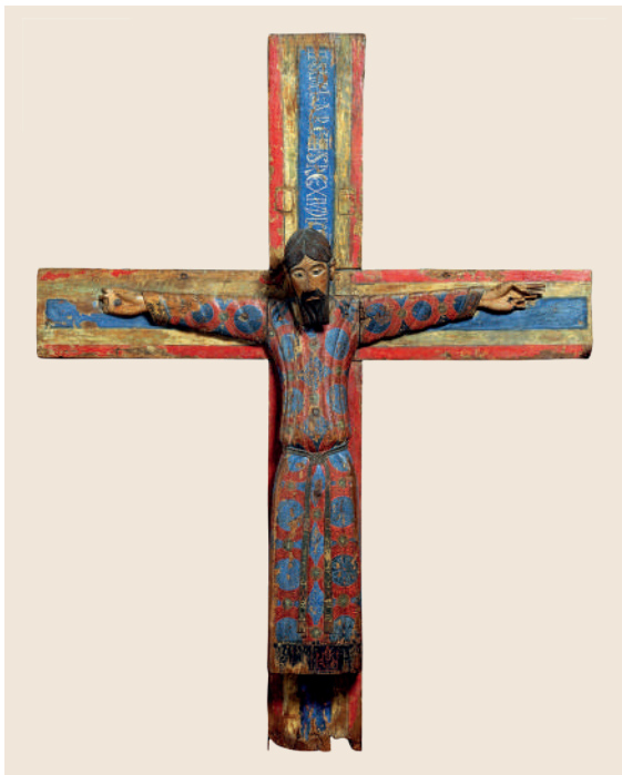
Majestat Batlló. Mitjan segle XII (Museu Nacional d'Art de Catalunya, MNAC 15937).