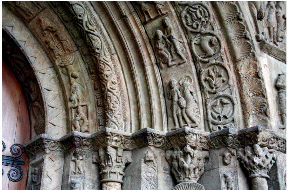
Santa Maria de Ripoll. Detall de la portada (ca. 1134-1151).

l'anomenat segon taller de la Daurade tolosana, Ripoll mostra punts de contacte en la concepció de les figures i de la seva indumentària, encara que no hi queda res de la fluïdesa compositiva de Tolosa de Llenguadoc. La portada ripollesa mostra una admirable síntesi, en què la profusió decorativa aplicada a la porta pròpiament dita en les arquivoltes i els brancals, també reflecteix records de conjunts italians i, concretament, de la Llombardia de les primeres dècades del segle XIII 17 .