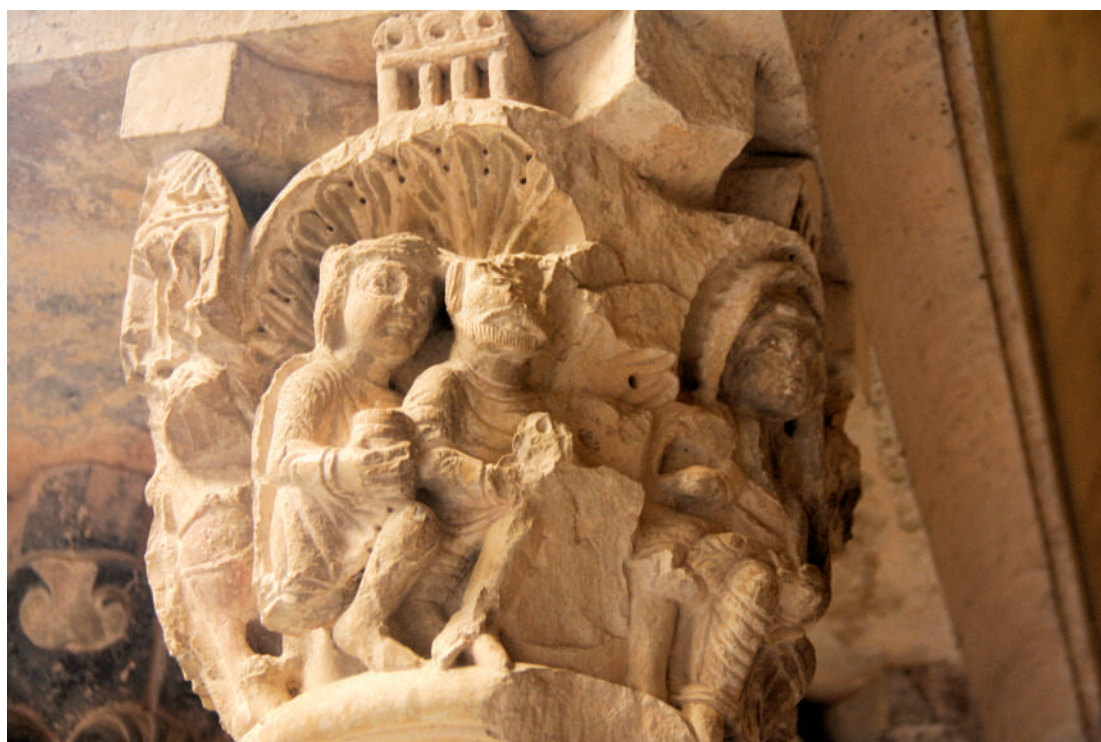
Sant Pere de Galligants, Girona. Capitell del claustre (ca. 1160-1180)

No gaire lluny de la catedral de Girona, el monestir benedictí de Sant Pere de Galligants ja havia mostrat a la seva capçalera l'influx de l'escultura tolosana –llenguadociana en general– amb una claredat aclaparant, en virtut de la seva vinculació amb el cercle del Mestre de Cabestany. Però ens interessa ara referir-nos a l'obra del claustre, marcada per la seva homogeneïtat, que ha de situar-nos cap a les dècades de 1160-1170 22 . En aquest conjunt es fonen els repertoris ja experimentats del món rossellonès i els ressos d'altres formulacions d'arrel antiquitzant, no allunyades de l'escultura del Llenguadoc mediterrani i de la Provença.