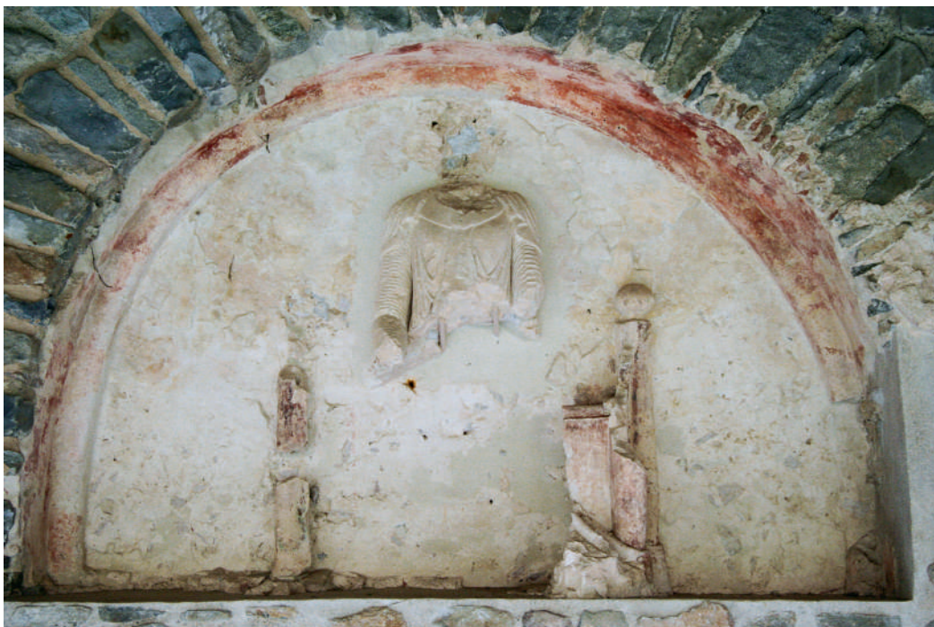
Santa Maria de Ripoll. Relleu de la Verge amb el Nen al claustre. Primera meitat del segle XIII?