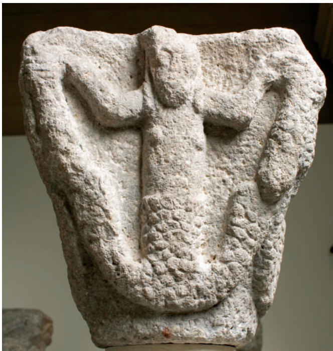
Sant Miquel de Fluvià. Capitel·l atribuït al claustre (Museu Nacional d'Art de Catalunya, MNAC 24019).