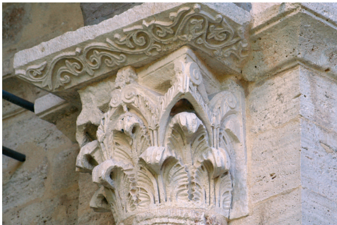
Santa Maria de Besalú. Capitell de l'interior de l'església. Segon terç del segle XII

tant a l'escultura rossellonesa, com la solució monumental del finestral de la façana de Sant Pere de Besalú, com a la ripollesa, amb els repertoris de la qual s'associa la portada meridional de la parroquial de Sant Vicenç.