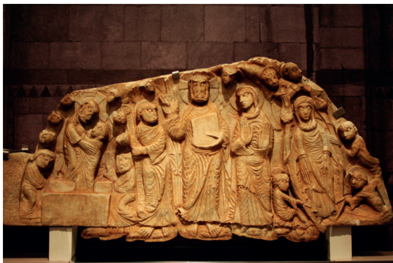
Santa Maria de Cabestany (Rosselló). Timpan. Mitjan segle XII