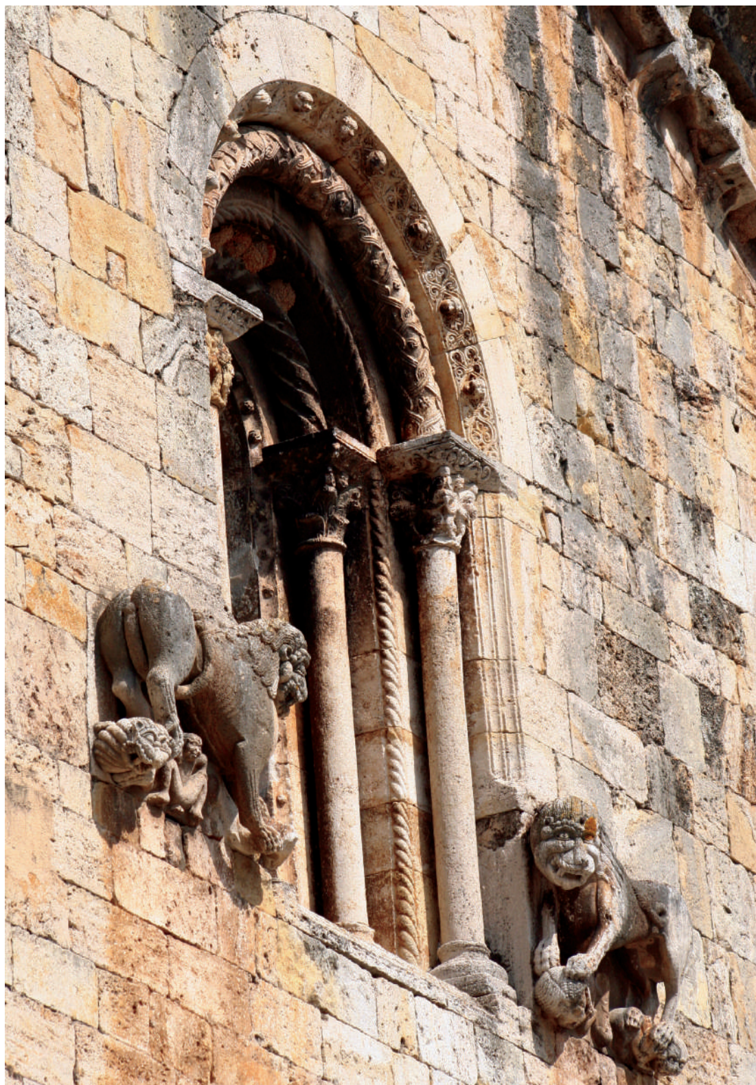
Sant Pere de Besalú. Visió del finestral de la façana occidental.

destacar la decoració de caràcter mediterrani, antiquitzant, de Santa Maria de Besalú, no aliena com ja s'ha dit a l'esperit de Sant Ruf d'Avinyó 14 . D'altra banda, i en dates que encara haurien de precisar-se, l'excel·lent decoració, amb un programa historiat, del conjunt de la girola de l'església del monestir benedictí de Sant Pere. Amb relativa posterioritat s'hi van incorporar conjunts associats