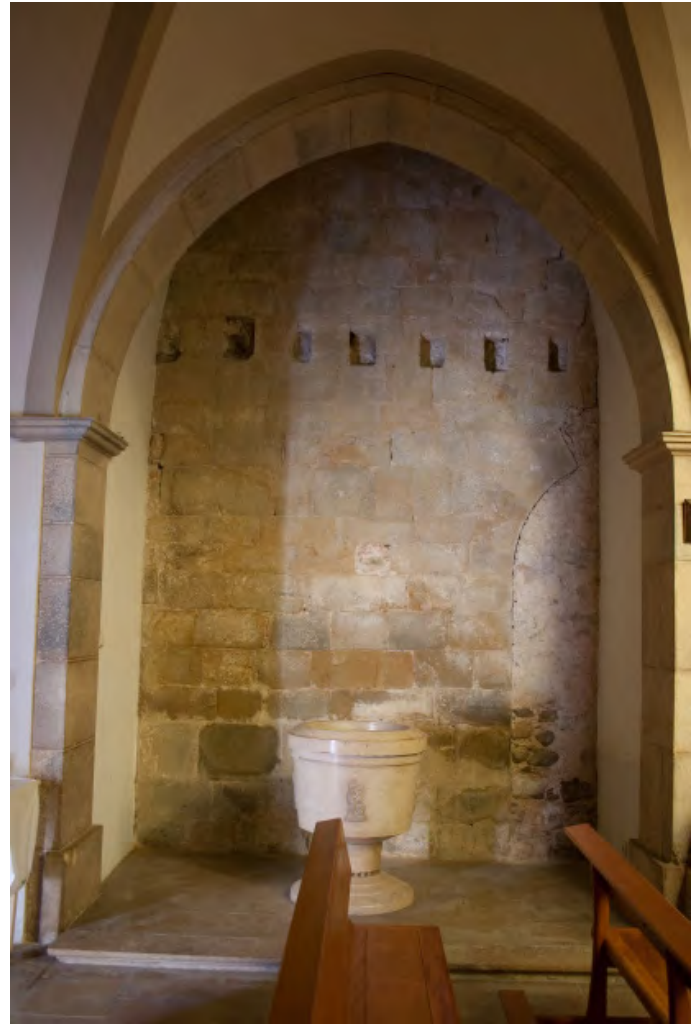
Interior. Vista del muro románico

Gracias a la fracción del muro testero conservado, sabemos exactamente dónde situar el muro perimetral norte del edificio, hoy perdido, pues aquí sí se conservan en muy buen estado las hiladas de sillares. El perfil superior de esta parte del testero, aunque de forma poco evidente, nos indica –como en la fachada principal– la altura aproximada del edificio románico. El ábside central no presenta decoración alguna, ha perdido sus ventanas y sería de tamaño reducido (de hecho, se ha señalado la peculiaridad que supone la existencia de un ábside tan estrecho, solo presente en edificios tan lejanos a Flaça como Santa Cecília de Molló o Sant Jaume de Querallbs, en la comarca del Ripollès).