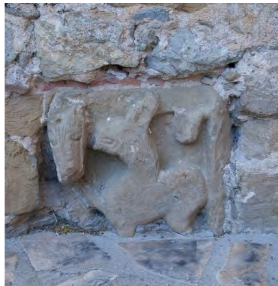
Antiguo relieve encastrado en el actual transepto