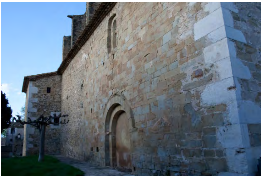
Antigua fachada occidental de la iglesia románica