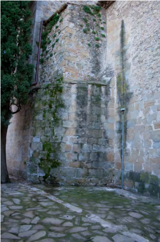
Restos del ábside románico