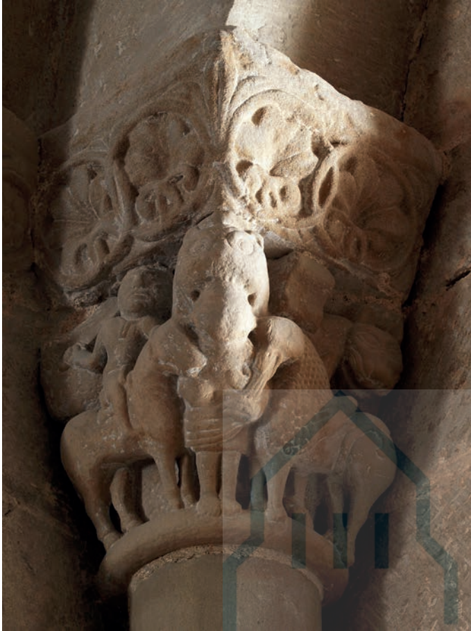
Capiteles de la ventana absidal