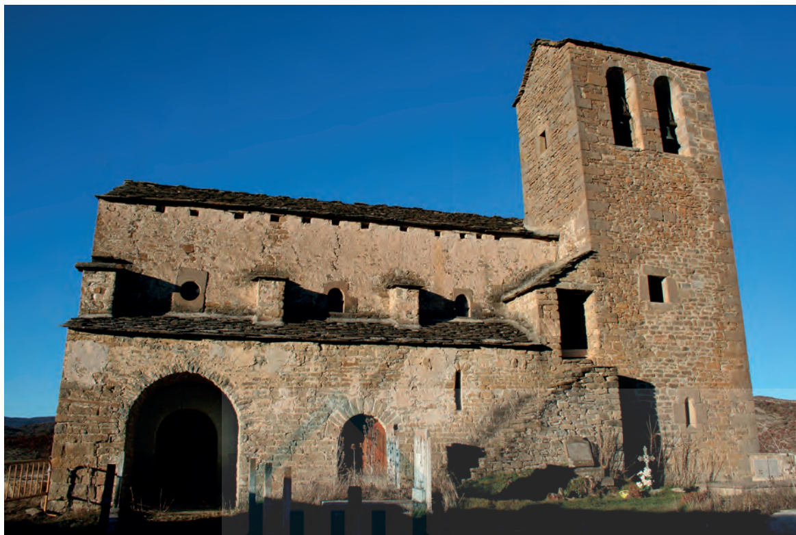
Vista desde el lado sur