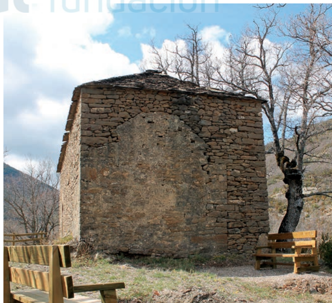
Vista de la cabecera

ARAMENDÍA, J. L., 200c, pp. 283-284; NAVAL MAS, A. y NAVAL MAS, J., 1980, I., pp. 25-27; RÍO MARTÍNEZ, B. d'o, 2005, p. 50.