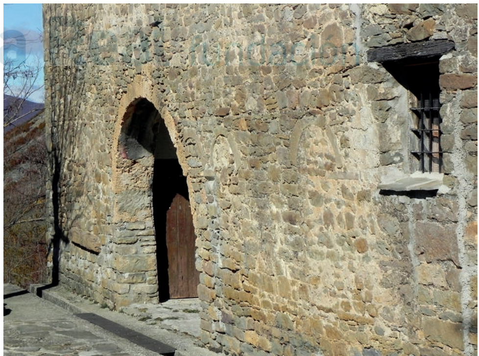
Muro del antiguo pórtico sur

siglos XVI y XVII. Lo que más nos interesa son los orígenes románicos del templo, que quedan evidenciados sobre todo en los restos de un antiguo pórtico exterior de vanos geminados