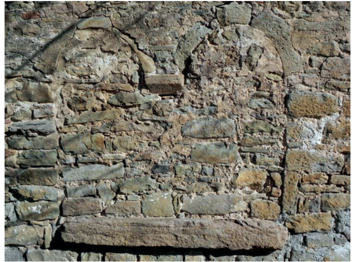
Arcos cegados del pórtico sur

Un pequeño detalle ubicado en altura al exterior del muro occidental y descentrado es una pequeña ventana as-