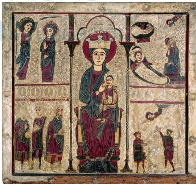
Frontal de altar (Museu Nacional d'Art de Catalunya, Barcelona, 2016. Foto: Jordi Calveras)

AA.VV., 1996c, pp. 313-317; ARAMENDÍA, J. L., 2001a, pp. 160-165; BORRÁS GUALIS, G. M. y GARCÍA GUATAS, M., 1977, pp. 367-368; IGLESIAS COSTA, M., 1985, I/1, pp. 133-135; IGLESIAS COSTA, M., 2003-2004, 1, pp. 214-221; OLAÑETA MOLINA, J. A., www.claustro.com/Betesa/Santa-MariadeRegatell .