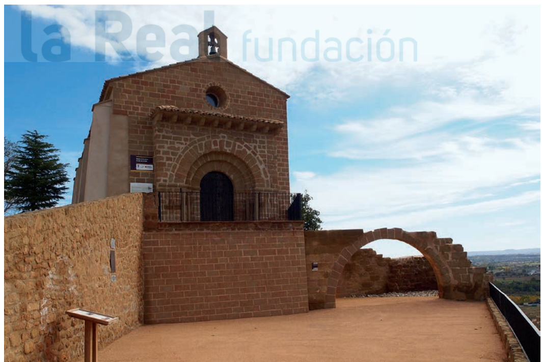
Vista desde el lado oeste

templo romano dedicado a la diosa de la fertilidad. Presenta una nave abovedada con cañón apuntado sobre cuatro arcos fajones y cabecera recta. Es una construcción de sillares re-