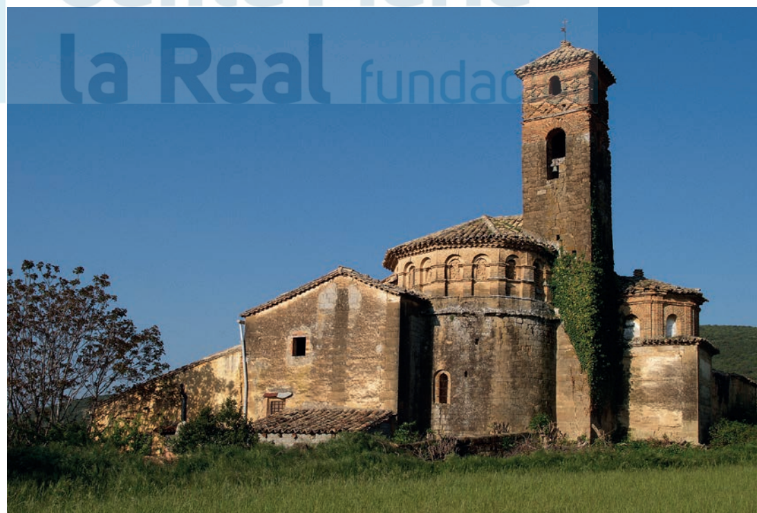
Vista desde el lado este con los restos del ábside románico

Presenta una nave única de planta rectangular rematada en ábside semicircular. El primero de los tramos de la nave se cubre con bóveda de cañón y los otros dos con bóveda estrellada, mientras que el ábside lo hace con cuarto de esfera. En las reformas se añadieron el coro elevado a los pies y las