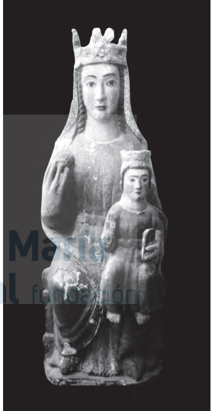
Virgen con el Niño

Cabe señalar que la Virgen porta el típico atributo de la esfera y que el brazo izquierdo lo despliega en ángulo obtuso cogiendo al Niño por la parte inferior. En cuanto a la indumentaria lleva velo, coronado con el habitual anillo –en este caso decorado– rematado en formas flordelisadas muy básicas, tiene manto sobre los hombros –cubre el brazo derecho y deja al descubierto el izquierdo– y la túnica con cinturón. Y con todo ello, se puede concluir que esta singular imagen es obra de finales del siglo XIII, y su ejecución nos habla de una mano artesanal, en todo caso quizás de un tallista local. Tal vez convendría pensar que este artesano pudo conocer la talla de Salas, pieza que observamos jugó un fuerte papel de bisagra en estos tiempos de transición al gótico.