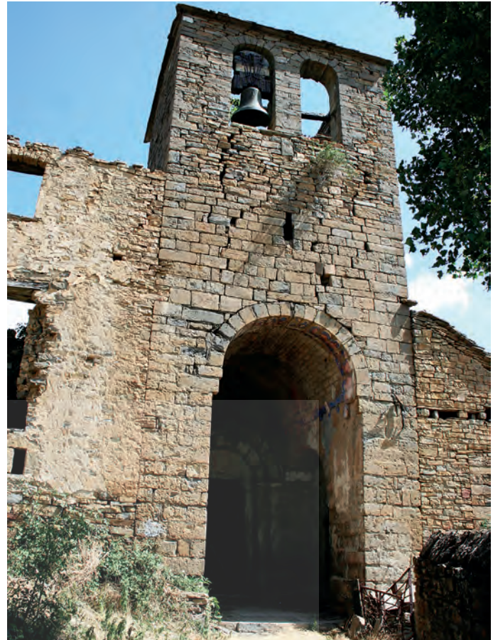
Torre y acceso a la iglesia

ACÍN FANLO, J. L., 2010, VI, pp. 22-25; BROTO APARICIO, S., 2004, pp. 18-21; CASTÁN SARASA, A., y MARTÍN, M., 1983, pp. 22-24; CASTÁN SARASA, A., 2005, pp. 15-19; CASTÁN SARASA, A., 2013a; CASTÁN SARASA, A., 2013b; GARCÍA OMEDES, A., www.romanicoaragones.com/Escartín ; SATUÉ SANROMÁN, J. M., 2004; SATUÉ SANROMÁN, J. M. y SATUÉ OLIVÁN, E., 1983.