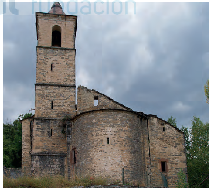
Vista de la cabecera

En cuanto a la cronología, el hemicíclo, único elemento románico puede datarse a finales del siglo XII.