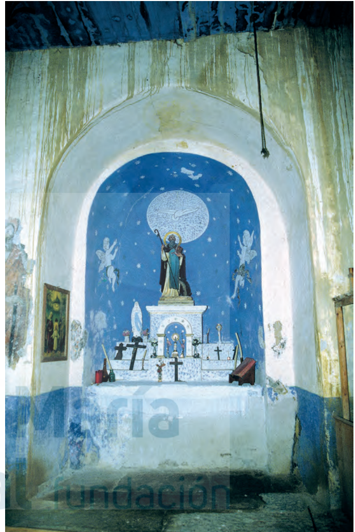
Interior del ábside

ARAMENDÍA, J. L., 2001c, p. 77, figs. 96, 97, 98, 99; CASTÁN SARASA, A., 1990, pp. 147, 148; CASTÁN SARASA, A., 2008, pp. 164-165; DURÁN GUIDOL, A., 1961a, nº 45-46; GARCÍA GUATAS, M. (dir.), 1992, II, pp. 321, 323; IGLESIAS COSTA, M., 2003-2004, 4, p. 51; MADDOZ, P., 1845-1850 (1997), p. 263; PALLARUELO CAMPO, S. (coord.), 2006, pp. 360, 361; UBIETO ARTETA, A., 1984-1986, IV, p. 1124; ZAPATER, A., 1986, IX, p. 2193.