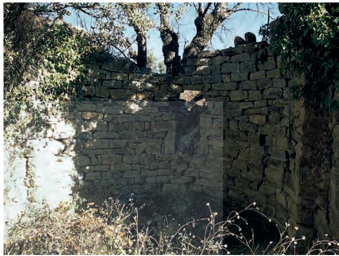
Interior del ábside