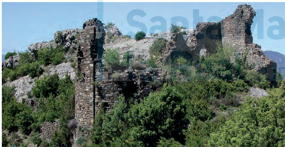
Ruinas de San Pelay

ARAMENDÍA, J. L., 2001b, pp. 305-307; DURÁN GUDIOL, A., 1991a, pp. 46-48; GARCÍA GUATAS, M. (dir.), 1992, I, p. 287; GARCÍA OMEDES, A., www.romanicoaragones.com/Ceresa ; IGLESIAS COSTA, M., 2003-2004, II, pp. 81-83.