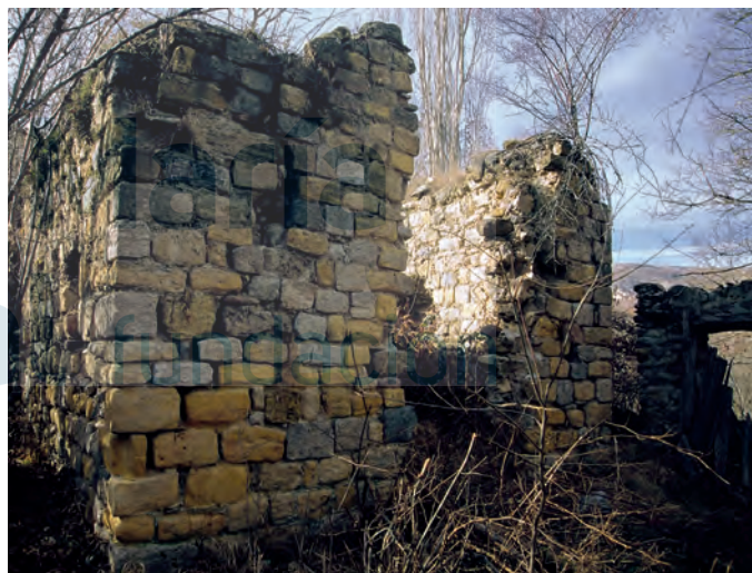
Restos de la ermita

AA.VV., 1996c, pp. 482-483; ARAMENDÍA, J. L., 2001a, pp. 158-160; IGLESIAS COSTA, M., 2003-2004, 3, p. 207.