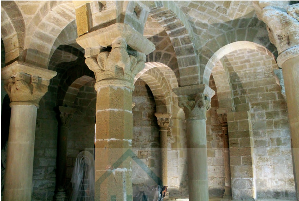
Interior de la cripta