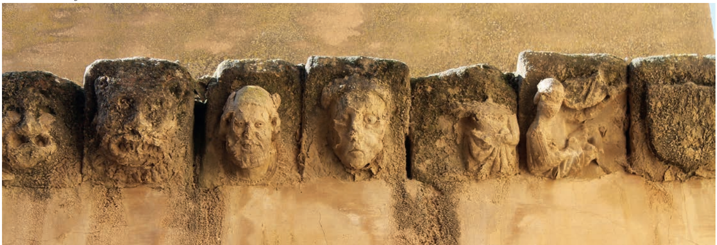
Canecillos del antiguo claustro

desapareció con la construcción de la sacristía pero todavía se pueden contemplar algunos restos, visibles desde la sala capitular que se encuentra sobre ésta, mediante los que se puede pensar que la cabecera original era de planta octogonal constituida por arquillos ciegos sobre los que todavía se ven los canecillos y la cornisa original correspondiente a los muros norte y este del templo, dando testimonio de la magnitud de esta obra en su tiempo. Del mismo modo, siguiendo la