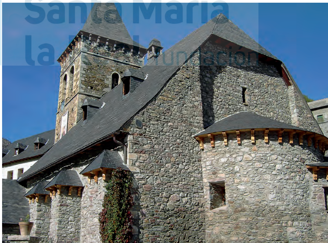
Vista general

La parroquial de San Esteban se levanta en el extremo oriental de la localidad. Se trata de un templo de tres naves, divididas en cuatro tramos que coronan en testeros rectos en los laterales y en ábside de planta semicircular la central. El acceso, como es habitual, abre en el lado sur, en arco de me-