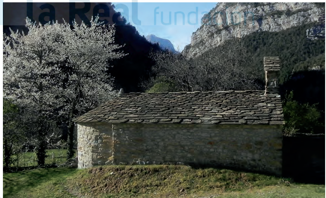
Vista desde el lado norte

Al exterior, la cubierta de la fábrica es de rústica losa de piedra que remata en pequeño pináculo pétreo en la zona