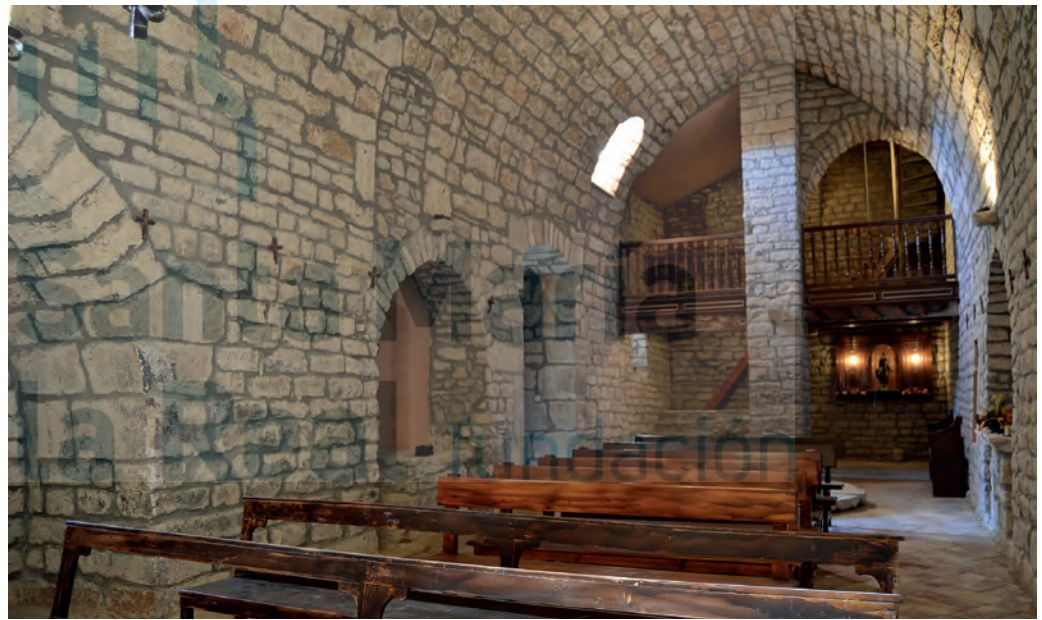
Interior, hacia los pies

punto pero la más cercana a la cabecera fue agrandada y convertida en un vano adintelado. A los pies, el coro de madera da acceso a la torre campanario, montada sobre dos arcos de medio de punto que apoyan en un gran pilar central.