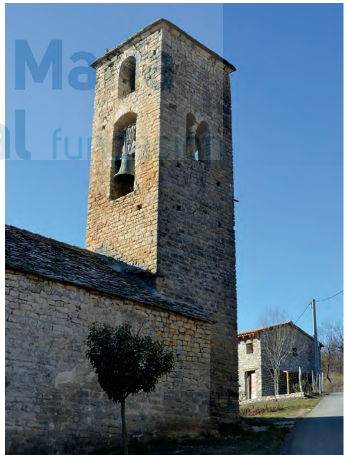
Vista de la torre

La torre románica, cuya fábrica de sillarejo muestra una retahíla de mechinales, está formada por un sólo cuerpo sin