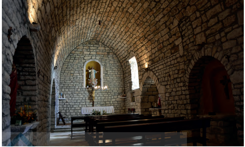
Interior, hacia la cabecera