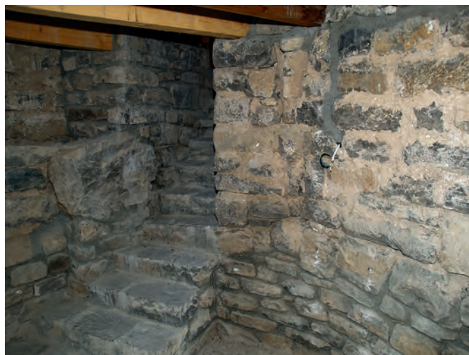
Acceso a la cripta

ARAMENDÍA, J. L., 2001b, pp. 318-319; GARCÍA OMEDES, A., www.romanoaragones.com/Sin .