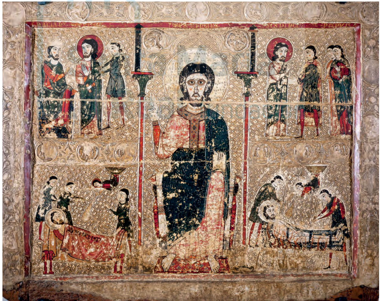
Frontal de altar. Museu de Lleida: diocesà i comarcal

Como se ha señalado, además de su relación con los frontales de Chía, Estet o Betesa, es evidente que su realiza-