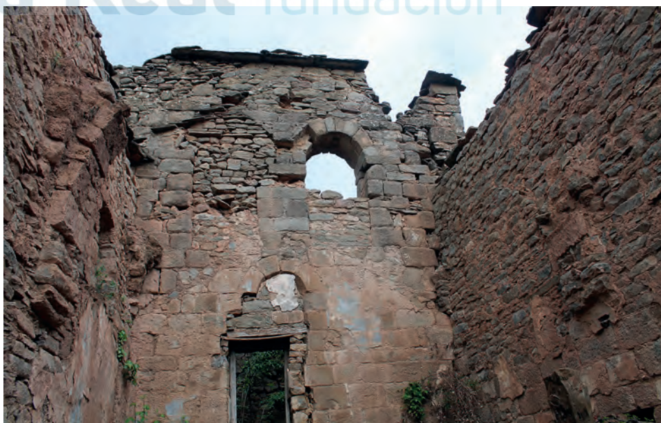
Interior de las ruinas

los siglos XVII y XVIII, momento en el que se abrirían las dos capillas laterales y se levantó la torre. La original, de una sola nave, pudo tener un ábside de planta semicircular del que hoy