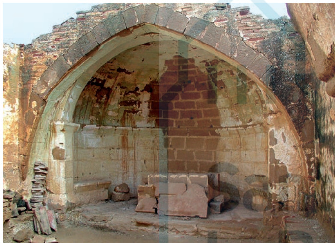
Interior del ábside, antes de su restauración

alza desde dos pilastras con sus aristas achaflanadas que contribuyen a enmarcar el ábside. En altura acaban en prominentes impostas que se continúan con la que recorre el cilindro absidal. Hay un inicio de bancada perimetral en cada lado del ábside. No posee vano absidal alguno. La nave se compone de tres segmentos delimitados por dos fajones apuntados. La puerta de acceso abre al sur en el segmento central de la nave.