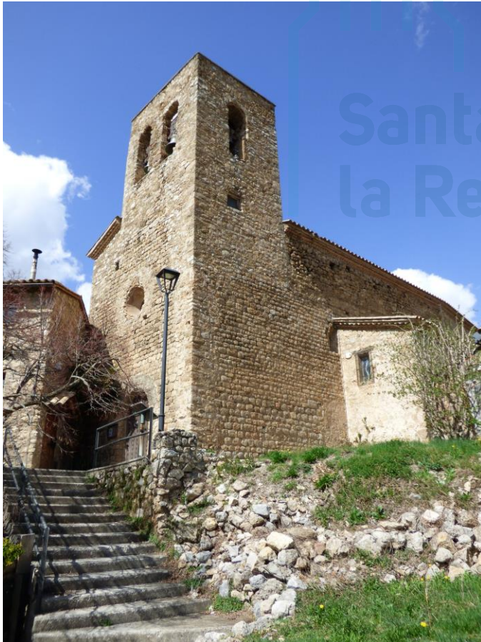
Fachada oeste y muro sur

hiladas inferiores, dispuesto en hiladas bastante uniformes. Tanto la portada y el óculo que se abren en la fachada oeste, como la torre campanario de la esquina suroeste, fueron añadidos en las reformas posteriores. En el muro meridional, junto al arranque de la capilla lateral, se observan los restos de lo que pudo ser la puerta original del templo, la cual estaba formada por un arco de medio punto. Sobre ella se conservan los vestigios de lo que fue una ventana de doble derrame y arco de medio punto. En el 2007 se rehabilitó el tejado y el interior de la iglesia.