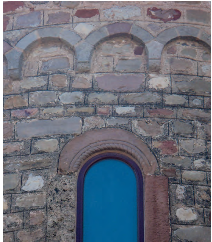
Ventana del ábside

CATALUNYA ROMÀNICA, 1984-1998, XVIII, pp. 371-372; MARTÍ I BONET, J. M., 1978-1981, II, pp. 428-437; VALL I RIMBLAS, R., 1983, p. 150.