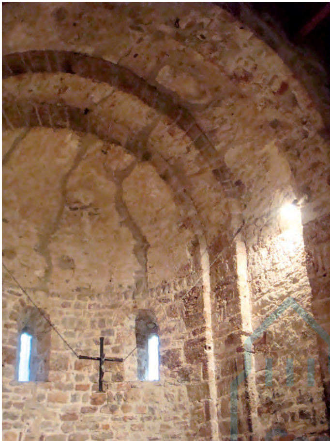
Detalle del interior

rebajó el pavimento del suelo hasta dar con el nivel marcado por esta. Como resultado de la intervención se encontraron los restos de unos muros situados transversalmente a la nave y separados entre ellos por un vano justo en la zona central,