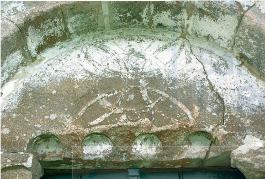
Detalle del tímpano occidental

En conclusión, este templo presenta una serie de similitudes con la puerta principal de San Cristóbal de Novelúa, lo que lleva a considerar que sea trabajo de un artista formado con el maestro Martín, del que toma su programa iconográfico pero que, sin embargo, no alcanza a desarrollar la misma habilidad. Asimismo, la relación con el maestro nos aporta un importante dato sobre su cronología pues, lógicamente, deberá ser posterior a su modelo, cuya construcción, según Yzquierdo, se desarrolla en torno a 1190. Otro elemento comparativo para dar con su cronología es la tipología de tímpano tetralobulado que comparte con San Xiao de Pedro-