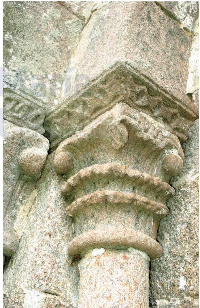
Capitel de la puerta occidental

En la parte superior de los muros quedan algunos toscos canecillos, labrados en proa en su mayoría y en el lado sur se distingue uno con decoración geométrica muy simple. En este flanco se abre una de las puertas originales que, como resultado de las modificaciones que se vienen comentando, tiene oculto parte del arco. A esta puerta pertenecería la parte del arco que se encuentra en el interior y sirve de peana.