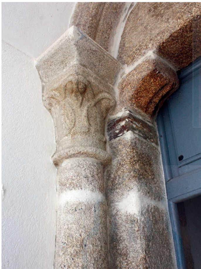
Capiteles de la portada