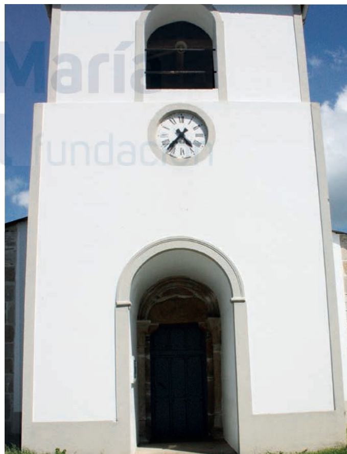
Portada bajo la torre

El arco de medio punto suaviza su arista mediante una moldura baquetonada y se desdobra en dos roscas aboceladas. Las columnas en las que se apea tienen fustes lisos y capiteles con un ábaco surcado por una media caña y ornamentados con una decoración muy estilizada; el de la izquierda presenta un sencillo entrelazo que remata en la parte superior en pequeñas bolas y el de la derecha se decora con hojas con un remate similar al del capitel izquierdo. Por otro lado, las basas presentan una solución extraña, según López