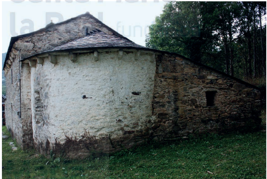
Vista general desde el ábside

La nave rectangular está cubierta de madera a dos aguas. Los muros laterales se rasgan con dos aspilleras, una a cada lado, con amplio derrame interno. En el lienzo meridional se abre una puerta adintelada de factura sencilla, donde el dintel monolítico es soportado por dos mochetas cortadas en