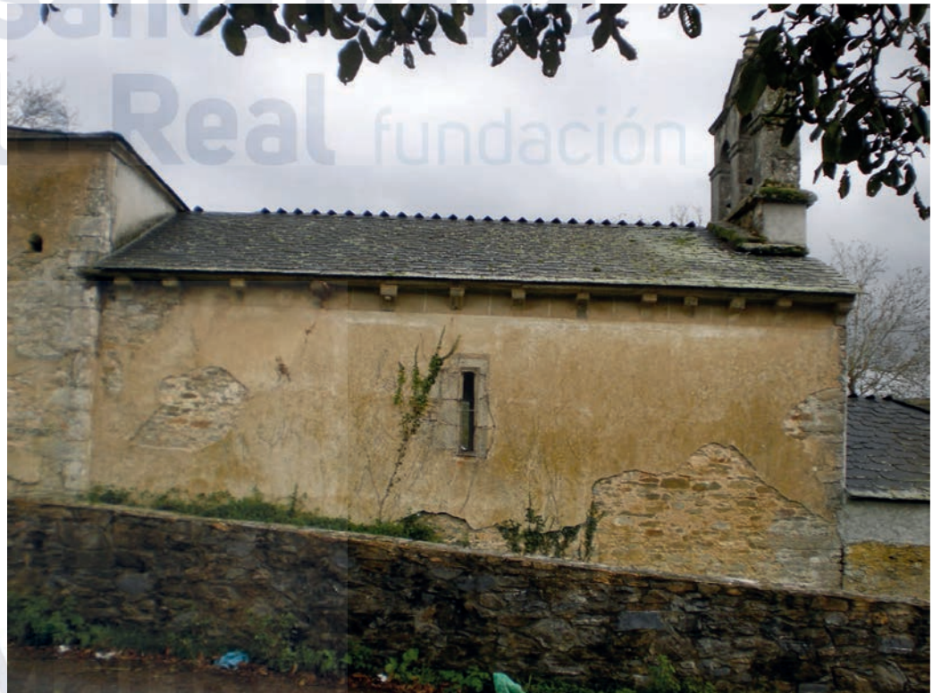
Muro norte de la nave

La nave se cubre con techumbre de madera a dos aguas. En los muros norte y sur se abren dos ventanas aspilleras con gran derrame interno que son los únicos puntos de luz de la nave, junto al estrecho vano de la fachada. Una fuerte cornisa