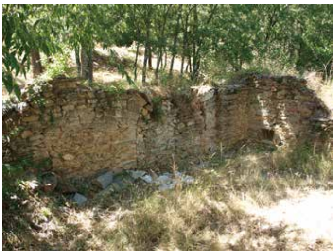
Restos de una portada y del muro oeste

la bifurcación del camino hacia Castellbò y Vilamitjana, una señal indica el sendero que arranca hacia el Norte al pie de la carretera, el cual conduce a Costoja tras recorrer apenas 200 m.