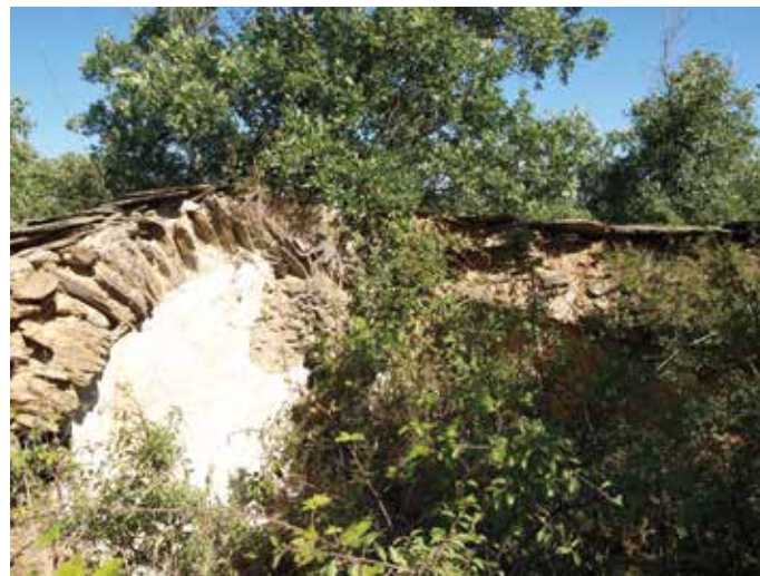
Ruinas del templo

Pese al colapso de la cubierta, en el lado noreste de la nave se conservan vestigios del arranque de la bóveda de cañón ligeramente rebajado, aunque de factura probablemente posterior a la obra original. Asimismo, en el muro norte se conserva la entrega de la bóveda a la cabecera, ejecutada con losas de esquisto a sardinel. En el flanco nororiental se abre una estrecha ventana cuadrangular de doble derrame, mientras que en el centro del muro meridional se encuentra una hornacina de notable profundidad, resuelta con un arco