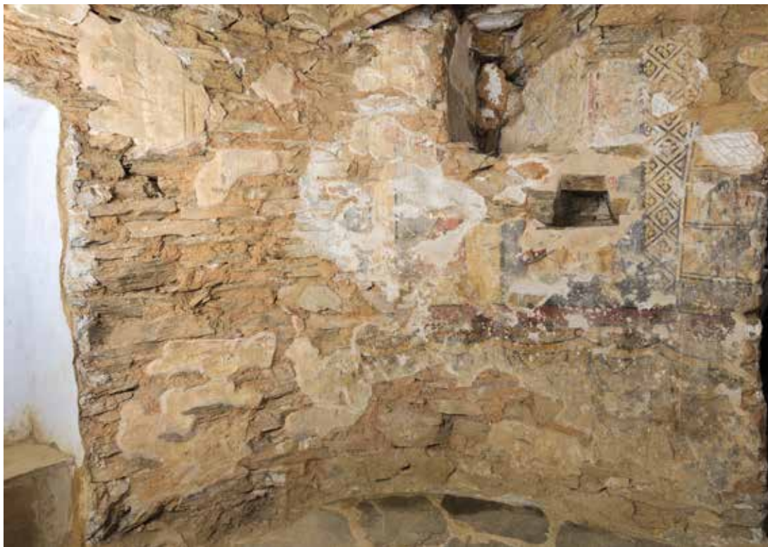
Pinturas del ábside norte.

la boca, el mentón y la parte inferior de la nariz de un cuarto personaje. Considerando que en la parte central del ábside, sobre la fuente que se añadió cuando se remodeló el espacio, habría espacio para otra figura, se puede pensar que al menos habría cinco personajes, quizás todos ellos santas.