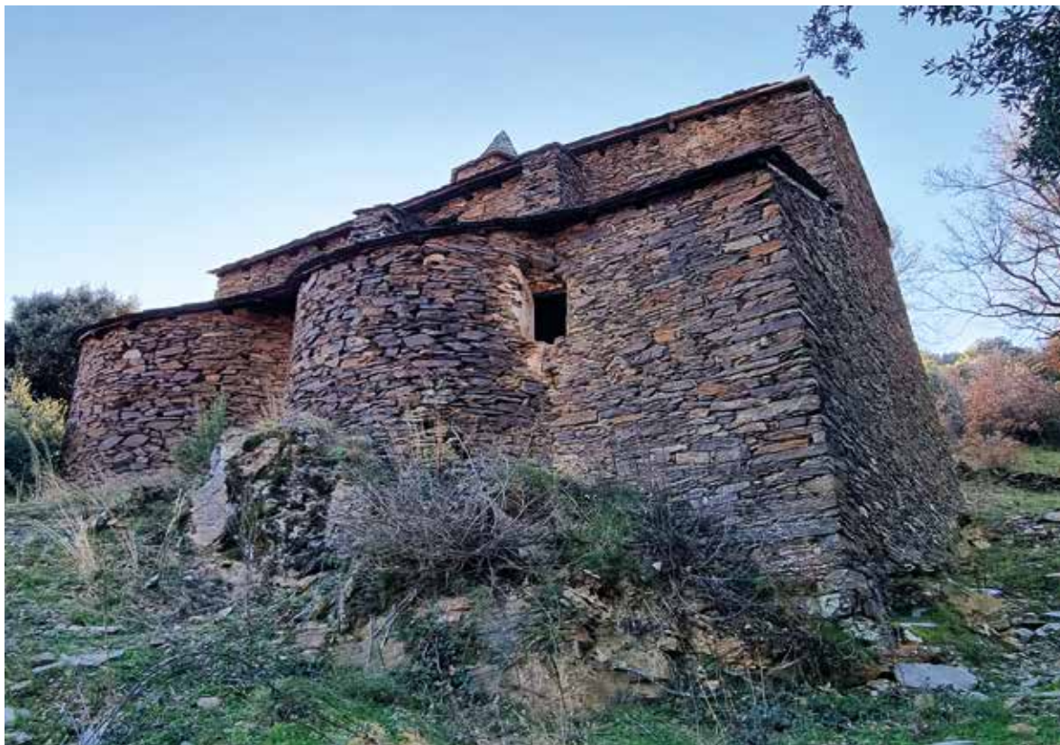
Vista exterior de la cabecera

en la vertiente sur de una sierra que tiene como máximas alturas los picos de les Mongetes y Roc Roi. Dista 15,8 km de Montferrer, desde donde se llega cogiendo un desvío hacia el Noroeste entre los km 230 y 231 de la carretera N-260, en dirección a Castellbò. Una vez en esta localidad, se ha de cruzar un estrecho puente sobre el río homónimo y tomar una pista no asfaltada hacia el Norte, por la que se han de recorrer 5,5 km hasta llegar a Solanell. La iglesia dedicada a san Julián se halla aislada en lo alto, al Norte del caserío.