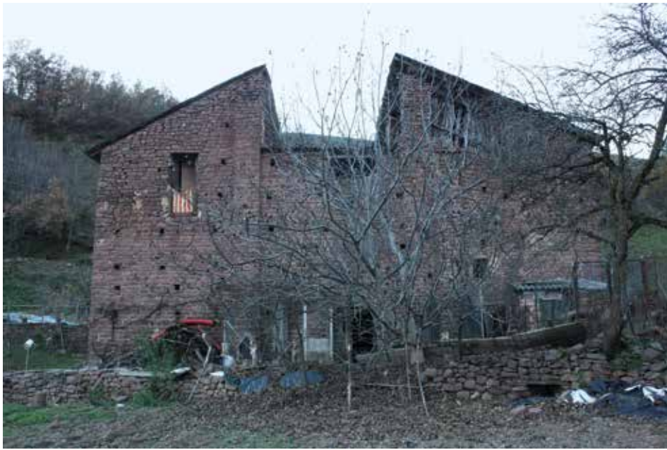
Restos de la nave lateral sur