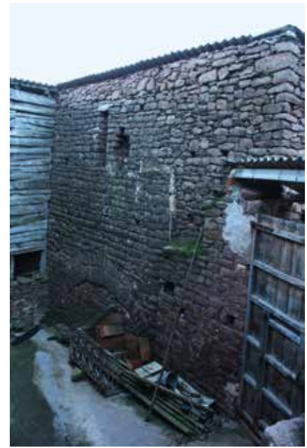
Vista exterior del hastial oriental