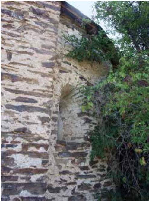
Detalle del ábside