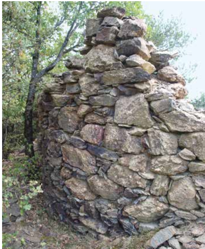
Restos del ábside

El estado actual del templo no permite obtener más información del mismo, aunque cabe la posibilidad de que la entrada original al mismo correspondiera con un pequeño vano localizado en el muro meridional. Además, el grosor de los muros sugiere que solamente el ábside era abovedado, mientras que la nave estaba cubierta con una techumbre sobre armazón de madera.