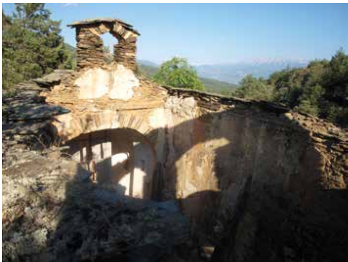
Restos del interior