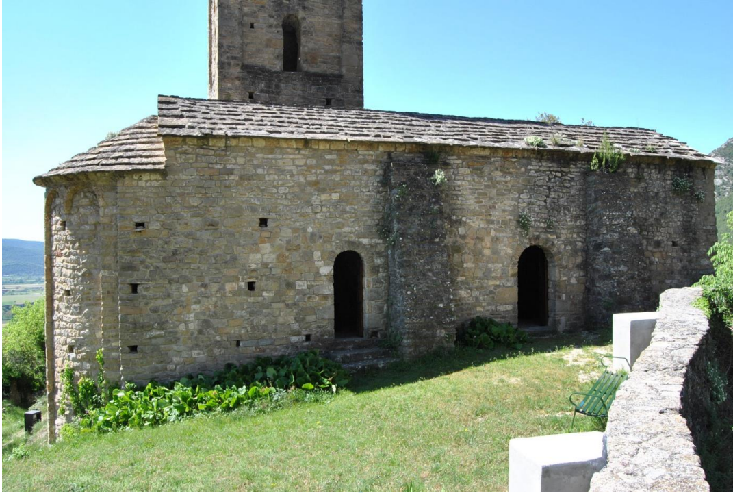
Vista exterior del muro norte