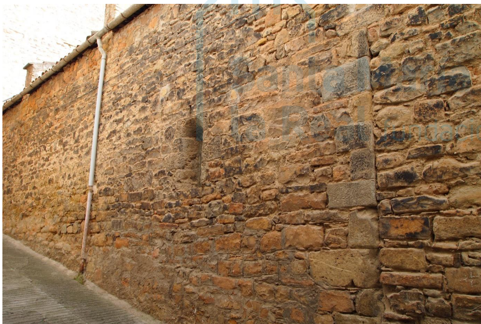
Vista del muro norte y ventana

LA PARROQUIA DE SANT ANDREU se encuentra en el centro histórico de Oliana, en la calle Cavallers, fácilmente localizable gracias a su esbelta torre campanario. Su nombre puede llevar a confusión, ya que su advocación coincide con la de la iglesia del castillo y antiguo pueblo de Oliana. El edificio actual fue construido entre los siglos XVII y XVIII, si bien aprovechó en su muro norte los restos de una edificación anterior, de la segunda mitad del siglo XII. En el fragmento de lienzo conservado se abre una pequeña ventana de doble derrame y arco de medio punto monolítico, que se encuentra tapiada. Asimismo, también se aprecia lo que habría sido la esquina noroeste del antiguo templo, en la que se utilizaron sillares de buen tamaño y bien escuadrados y pulidos, que contrastan con el tosco sillarejo empleado en el resto del lienzo.