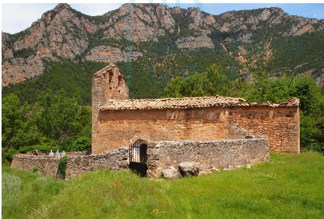
Vista general desde el sur

L ES ANOVES ES UNA ALDEA situada a 13,5 km al norte de Oliana, desde la cual arranca una pista forestal hacia el Sur que, al cabo de poco tiempo, gira hacia el Norte. Recorridos 1,5 km se llega a la iglesia. Esta población ya se encuentra referenciada, como Lezoneas en 972 en una donación a Santa Maria de La Seu d'Urgell de unas viñas situadas en dicho valle. En 1024 se menciona la parroquia de Lazovez y en 1036 el lugar de Lezonoves . Como Lezonoas , figura citada la parroquia en la polémica acta de consagración de la catedral urgelense. Asimismo, aparece también en el acta de consagración de Sant Serni de Tavèrnoles de 1040. Sin embargo, no se ha conservado ningún documento de época medieval que haga referencia a una iglesia dedicada a santa Eulalia en este lugar.