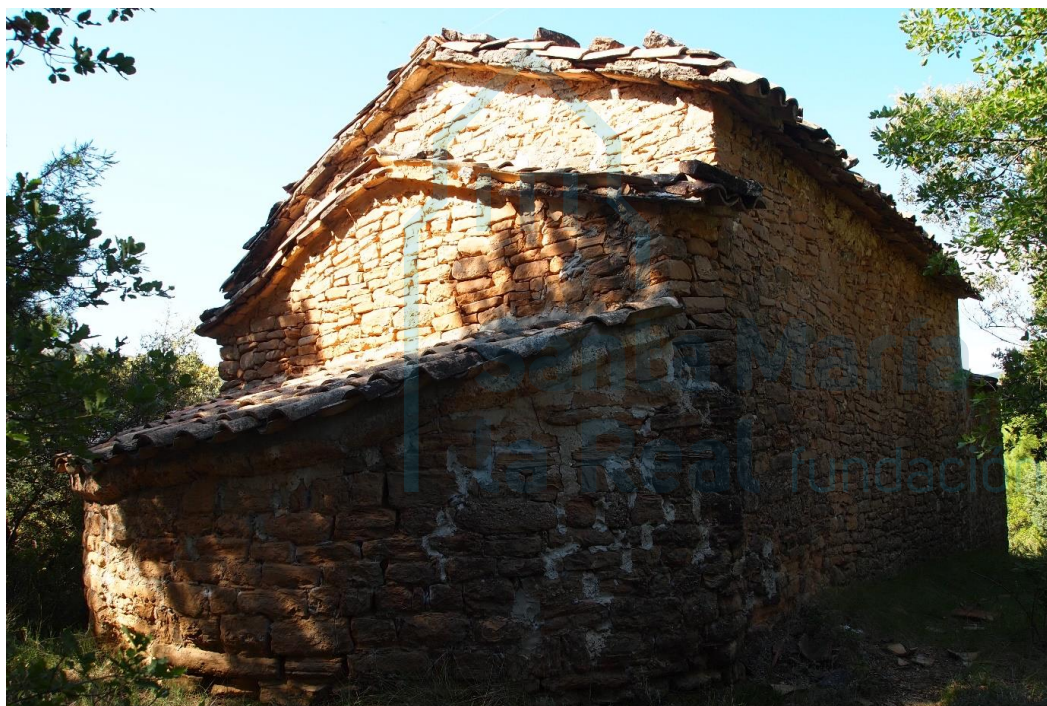
Cabecera y muro norte

En el interior, la nave está cubierta por una bóveda de cañón reforzada por dos arcos fajones que delimitan tres tramos. Por su parte, en el ábside se sustituyó la habitual bóveda de cuarto de esfera, que debió de venirse abajo –quizás conjuntamente con la de la nave–, por un envigado inclinado de madera plano. El hemiciclo absidal quedó separado del resto del templo por un tabique, con lo que pasó a desempeñar la función de sacristía.