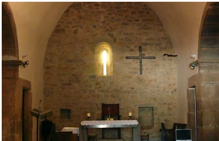
Interior de la cabecera

La iglesia que nos ocupa consta de una sola nave rectangular cubierta con una bóveda de medio cañón ligeramente apuntado, que data de época románica, así como de varias capillas añadidas a posteriori a sus muros laterales. Su cabecera es rectangular, lo que representa una solución poco habitual en los edificios románicos; ello, unido al hecho de que dicha cabecera fue levantada con un tipo de aparejo diferente del de la nave, nos lleva a considerar la posibilidad de que la cabecera fuera fruto de una reforma tardía, que también podría haber comportado el sobrealzamiento de la nave. En la fachada sobresale la portada, de origen moderno, por encima de la cual se abre un ojo de buey. El campanario, también reformado con posterioridad a la construcción del templo original, es de espadaña y tiene una cubierta volada a dos vertientes. También fueron añadidos al edificio en época moder-