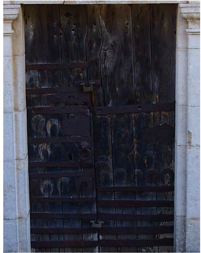
Detalle de los herrajes de la puerta

el arco triunfal que conecta el ábside con la nave, de perfil apuntado. En el exterior, el ábside luce una cornisa moldurada muy rudimentaria. En el centro del mismo muro absidal se abre una ventana de medio punto monolítico. Al sector norte del templo se adosan otras construcciones, mientras que a mediodía tiene añadidos diferentes cuerpos constructivos, entre ellos un campanario de base cuadrangular en el ángulo sureste. Tanto la nave como el ábside fueron sobrealzados en las mencionadas reformas del siglo XVII. La puerta de entrada, así como el óculo que se abre encima de ella, corresponden también a este momento tardío. Los muros de la construcción están contruidos con sillares regulares de piedra arenisca. Por sus características, podemos apuntar que la construcción original podría ser fechada a principios del siglo XIII.