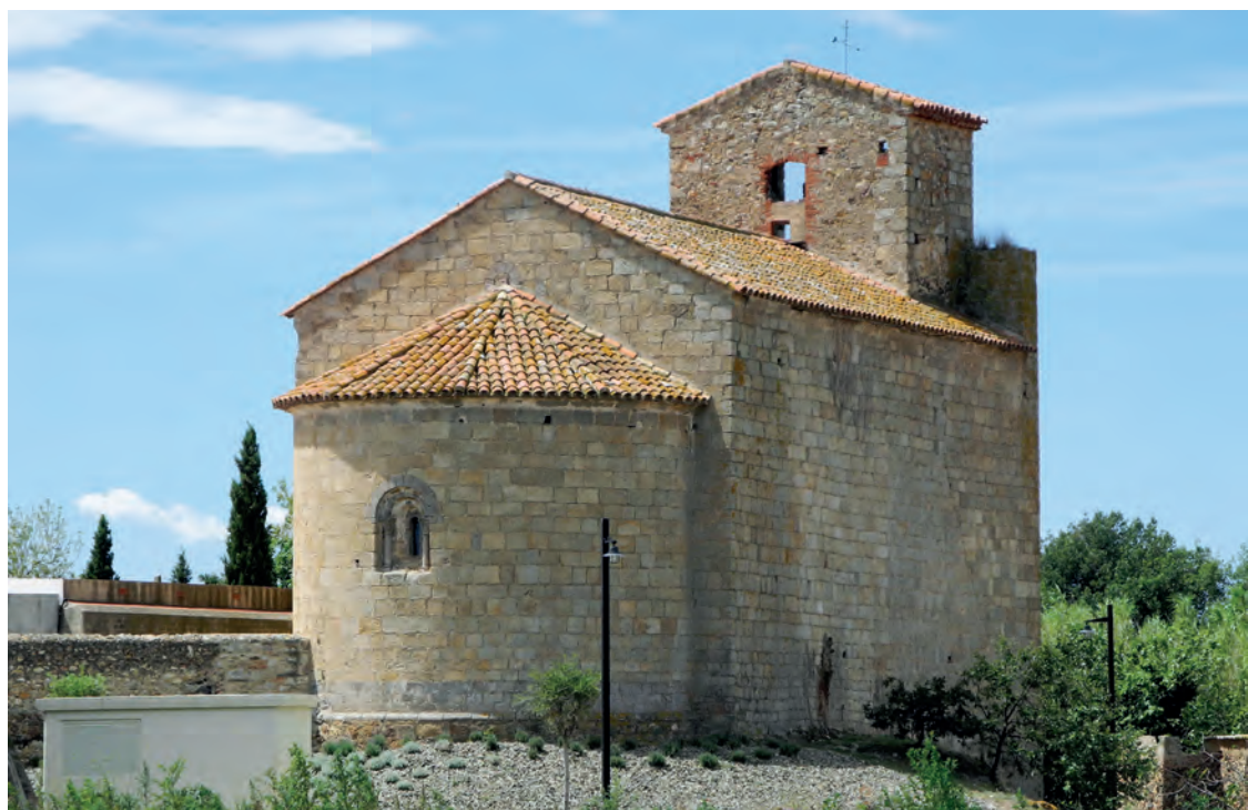
Vista general des de l'est

L'església de Pedret està documentada per primer cop l'any 974. Al segle següent, l'any 1060, la comtessa Guisla d'Empúries va fer donació a la seu de Girona d'un alou en el seu terme parroquial. Més endavant, el 1127, Ramon Ademar de Rabós fa entrega dels seus drets de cobrament de setanta sous a aquesta església i als seus capellans. Novament, el 1279 i 1280, trobem referències a Sti. Stephani de Pedroto a les Rationes