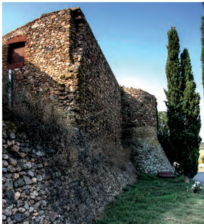
Vista del sector nord

El recinte, de petites dimensions, conserva diversos trams identificables. A la part septentrional, delimitada pel carrer del Nord, es conserva una torre cilíndrica amb el basament atalussat, i, a banda i banda, dos murs amb el talús també ben marcat. Aquest talús està construït amb blocs de pedra de grans dimensions pràcticament sense tallar, disposats en filades irregulars i units amb abundant morter de calç. Per la seva banda, el cos cilíndric de la torre (que ha perdut el seu coronament original) presenta dos tipus d'aparell diferents. La part inferior té les mateixes característiques constructives que el talús, i presenta una espitllera formada amb quatre grans pedres desbastades. La part superior presenta un