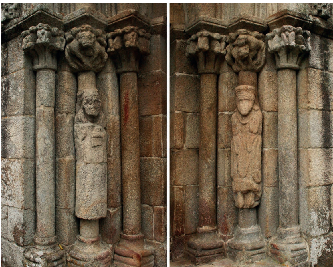
Colunas do portal oeste