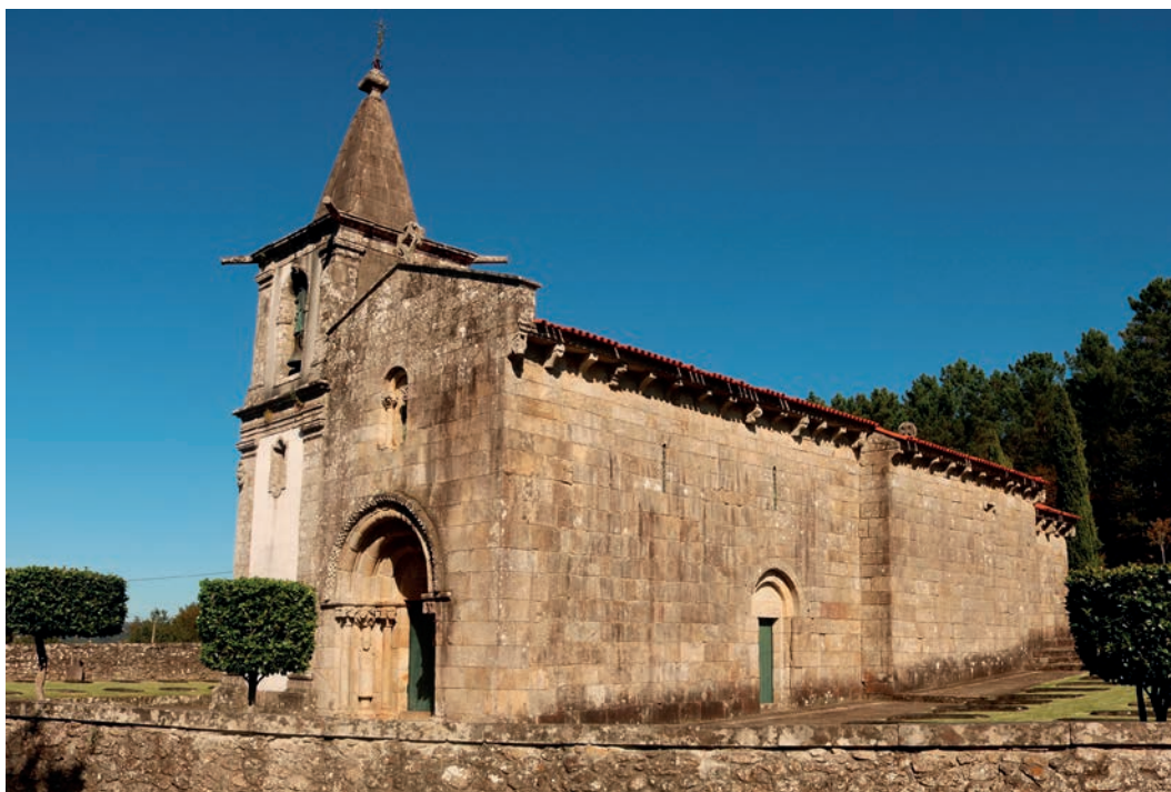
Perspetiva geral da igreja a partir de sudoeste

profundas. A cabeceira é construída em granito e apresenta aparelho pseudo-isódomo. O alçado oriental, onde se rasga uma estreita fresta de alargamento interno, é rematado em duas águas apresentando, a cornija, uma decoração em enxaquetado. O alçado norte, parcialmente encoberto por uma pequena sacristia de época posterior, é coroado