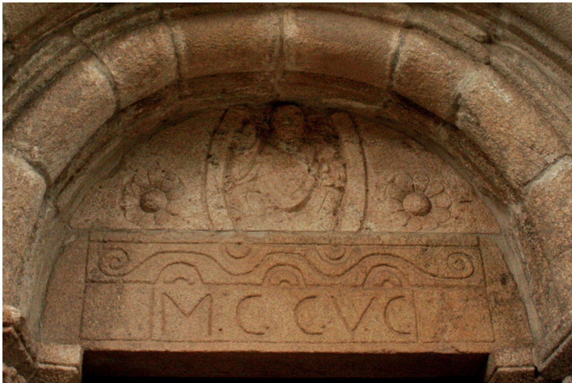
Tímpano do portal oeste