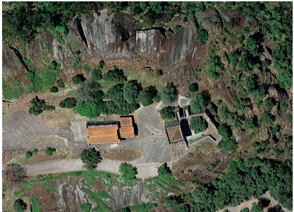
Castelo de Lanhoso. Vista aérea

e ao período de ocupação romana. Os testemunhos arqueológicos apareceram em 1938-39, quando a DGEMN começou o restauro do castelo de Lanhoso e decidiu abrir uma estrada – aquela que, ainda hoje, facilita o acesso ao alto do afloramento granítico –. As escavações colocaram a descoberto várias casas castrejas, umas com a sua característica planta circular, dotadas de átrio, outras já de planta retangular. Algumas continuam visíveis, de um e outro lado da estrada, e um pequeno núcleo foi reconstruído.