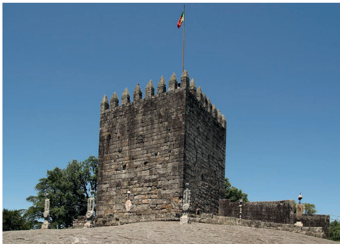
Torre de Menagem de D. Dimis, responsável pela destruição da estrutura pré e proto-românica da alcáçova de Lanhoso

Texto: MJB - Fotos: MJB/JNG - Plano: CMLan/PN