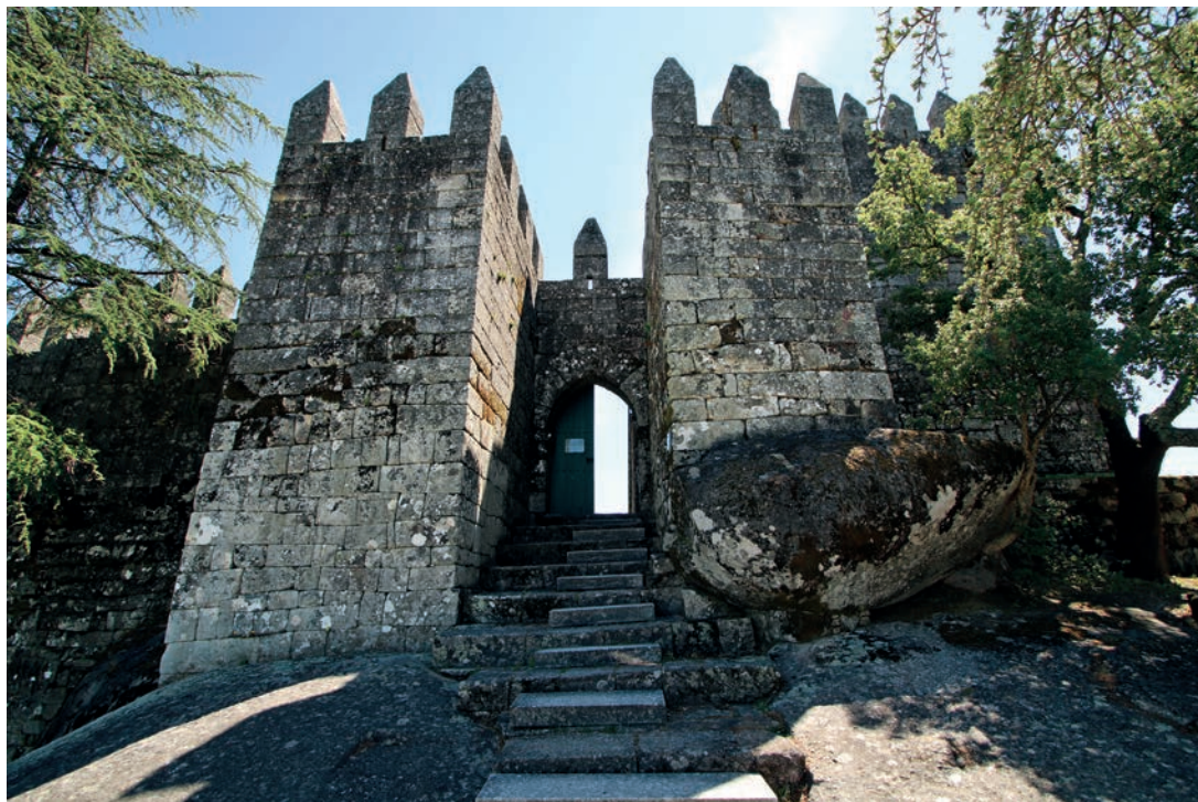
Torreões enquadrando a porta de entrada da Alcáçova. Fase mais antiga da construção dos torreões na base (Fase I)