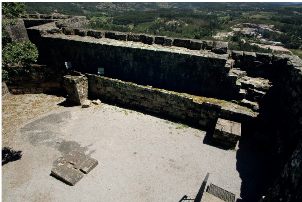
Pilares da estrutura residencial condal, no pátio do castelo

XI já tinha a planta que manteve na fase proto-românica, do bispo D. Pedro. O visitante poderá, ainda, admirar diversos pilares de secção quadrangular, de boa qualidade, que nos documentam a existência de uma estrutura de tipo palatino no interior da alcáçova do castelo de Lanhoso. Foi aqui que a condessa D. Teresa se recolheu, em 1120 ou 1121, fugindo dos exércitos de sua meia-irmã e do prelado compostelano. O espaço do castelo de Lanhoso conheceu sucessivas obras de manutenção. É natural que, depois dos trágicos eventos protagonizados por Rui (ou Rodrigo) Gonçalves de Palmeira, tenha havido necessidade de trabalhos de reconstrução, enquadrados no âmbito da anúduva . Mas a reforma mais radical ocorreu com o reinado de D. Dinis, quando a fachada sul, com os seus três torreões equidistantes erguidos sobre supedâneo, foi demolida para, em seu lugar, ser erguida a torre de menagem dionisina que ainda hoje ali se pode observar. Esta torre, com 10 m de largura e organizada em três pisos (rés-do-chão, fechado, e dois andares sobradados), implantava-se sobre a muralha do castelo, expondo os alicerces da metade meridional da sua estrutura. Nesse aspeto, a sua implantação é tipicamente gótica. Na fachada virada a sul apresenta o escudo régio português, assinalando o protagonista pela sua construção. O acesso, garantido por porta de arco quebrado aberta no 1º andar, é servido por escada de pedra que resulta de intervenção da DGEMN,