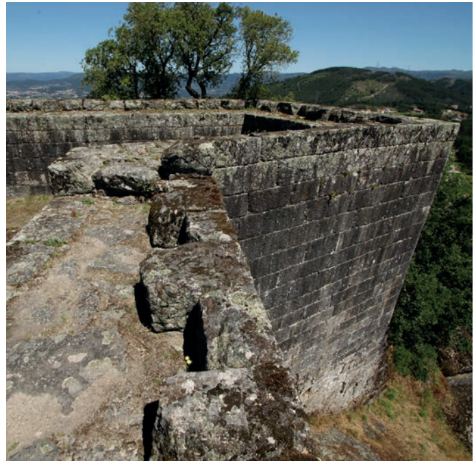
Torreão nordeste do recinto muralhado exterior