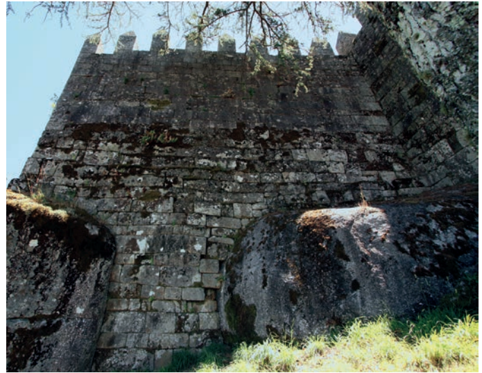
Vestígios da fase pré-românica, encaixados entre afloramentos graníticos

No prospeto voltado a sul e ao santuário, são visíveis os testemunhos de um supedâneo (embasamento) onde se individualizam três plataformas ou espaços subquadrangulares, separados entre si por espaços livres com 2,15 m de largura. Sobre estas plataformas ergueram-se três torreões, sensivelmente equidistantes, que apresentavam dimensões muito semelhantes, entre 3,40 e 3,60 m de largura. Do torreão ocidental restam oito fiadas de silhares, sendo de fácil reconhecimento. O torreão central, parcialmente desmontado, encontra-se embutido na base da torre de menagem. E o torreão leste, o mais arruinado, tem os seus alicerces bem visíveis nas estruturas que a DGEMN deixou à mostra, depois do desaterro que realizou em toda a estrutura da alcáçova. Contornando a fachada do castelo pelo seu lado ocidental, à esquerda, o visitante depara com uma porta de entrada enquadrada por dois torreões – uma solução que repete a que se encontra na muralha periférica –. Nestes torreões são visíveis várias fases no aparelho construtivo. Salientemos apenas as duas primeiras: a