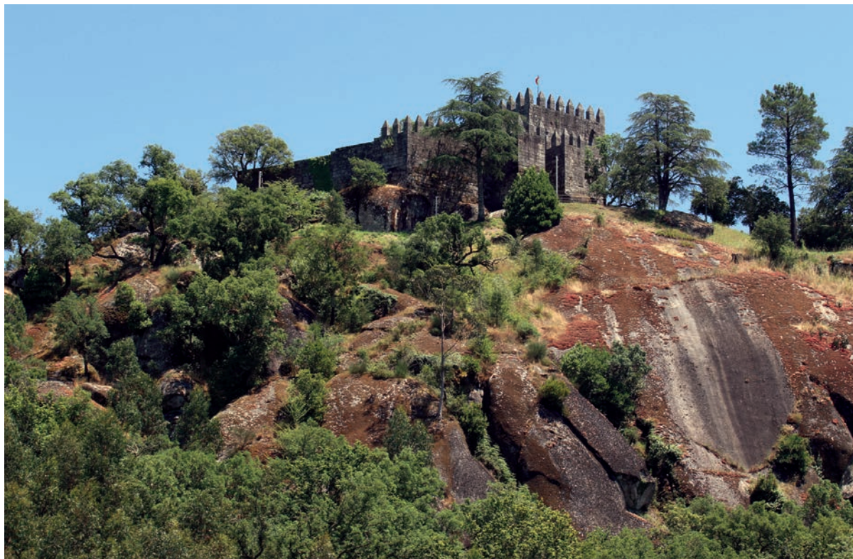
Vista geral do castelo de Lanhoso a partir de noroeste

1059 e 1086 e, por via epigráfica, desde [1070-1091]. A estrutura militar inicial, erguida nos finais do século X ou inícios da centúria seguinte, conheceu uma reconstrução por iniciativa do bispo D. Pedro (1070-1091), o restaurador da diocese de Braga. O interesse do prelado bracarense pelo restauro de Lanhoso prende-se, obviamente, com o controle da via romana que ligava Astorga e Chaves à cidade episcopal de Braga (a Via XVII do Itinerário de Antonino), que continuava a ser um eixo viário fundamental na Idade Média. Algumas décadas mais tarde, o castelo de Lanhoso seria escolhido pela condessa portugalense, D. Teresa, para aqui se refugiar dos exércitos de sua irmã, a rainha D. Urraca, e do arcebispo de Compostela, Diego Gelmires, quando estes invadiram o norte do Condado Portugalense. Os eventos, que decorreram em 1120 ou 1121, encontram-se memorizados na Historia Compostellana . Isto significa que, aos olhos da condessa portugalense, o castelo de Lanhoso seria considerado a estrutura mais forte que estaria ao seu dispor na zona de Braga e Guimarães. Aqui a condessa promulgaria um documento, em julho de 1120, e aqui seria assinado o tratado de Lanhoso, celebrado entre as duas meias-irmãs, filhas de Afonso VI de Leão. Apesar do castelo ter uma origem mais antiga, desde os inícios do século XII – pelo menos desde 1110, se não antes – presidiu militarmente à Terra de Lanhoso. Ao longo dos séculos XII e XIII conhecem-se vários tenentes