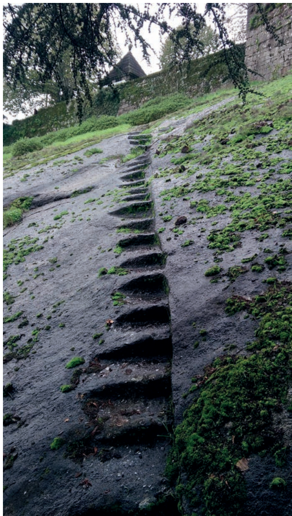
Acesso medieval ao castelo, com degraus escavados no afloramento rochoso