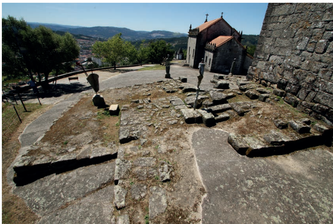
Vestígios da sapata dentada pré-românica e do alicerce do primeiro torreão