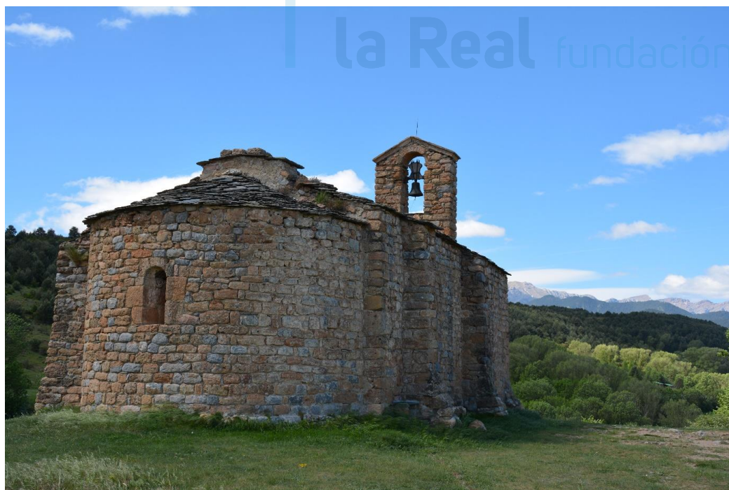
Vista general desde el noreste

Se trata de un pequeño edificio de arquitectura sencilla, formado por una sola nave y un ábside semicircular liso, sin ningún tipo de ornamentación, en el que se abre una ventana de doble derrame y arco de medio punto adovelado. Los muros de la iglesia no llegan al metro de espesor, lo que hace suponer que la nave estaba cubierta originalmente con entramado de madera y que posteriormente fue sustituida por una bóveda de cañón de perfil semicircular. El aparejo exterior de los muros está compuesto de piedra local, ligeramente trabajada, colocada en hiladas regulares. En la última reforma se reabrió la puerta de entrada originaria en el muro de mediodía. El ábside es muy sencillo, de paredes gruesas y un aparejo rústico de piedras simplemente desbastadas, colocadas en hiladas irregulares. En el centro se abre una ventana, ya mencionada. La fachada de poniente fue totalmente modificada en el siglo XVIII. En ella se ubican actualmente la puerta de acceso y óculo. Está rematada por un campanario de espadaña de un solo vano. De esta época datan los contrafuertes que, en número de tres, sostienen los muros norte y sur del edificio.