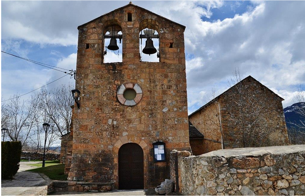
Vista de la fachada oeste.

El ábside, que debió ser semicircular en origen, se substituyó por el rectangular actual. De la etapa románica, apenas queda un fragmento del muro de mediodía.