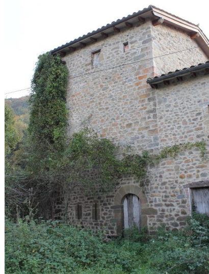
Fachada principal con acceso

La casa fuerte de sa Mas3 pertenecià a los bailes de la abad3a de Sant Benet de Bages, que pose3a derechos y jurisdicci3n sobre les Preses desde el siglo X. El linaje se enriqueci3 y emparent3 con la pequena nobleza de la zona mediante varios enlaces matrimoniales, el primero del cual tenemos constancia en 1153.