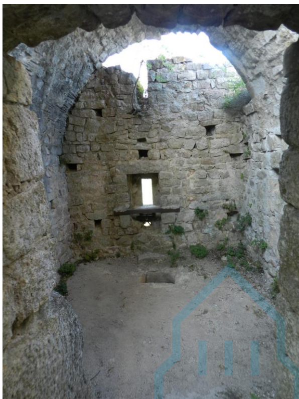
Piso superior de la torre

La construcción del santuario en el siglo XVIII ocupó espacios que correspondían al recinto del castillo, que en ese momento ya estaba en ruinas, como hemos apuntado.