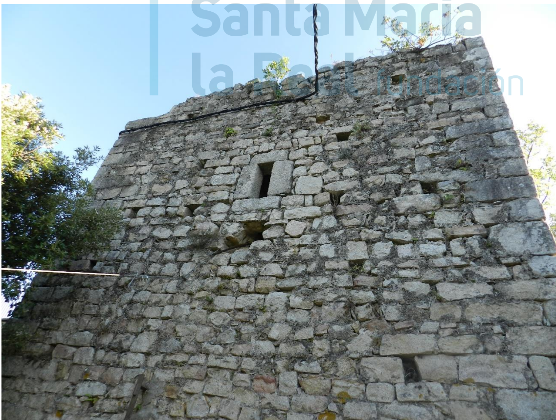
Restos de la torre cuadrada