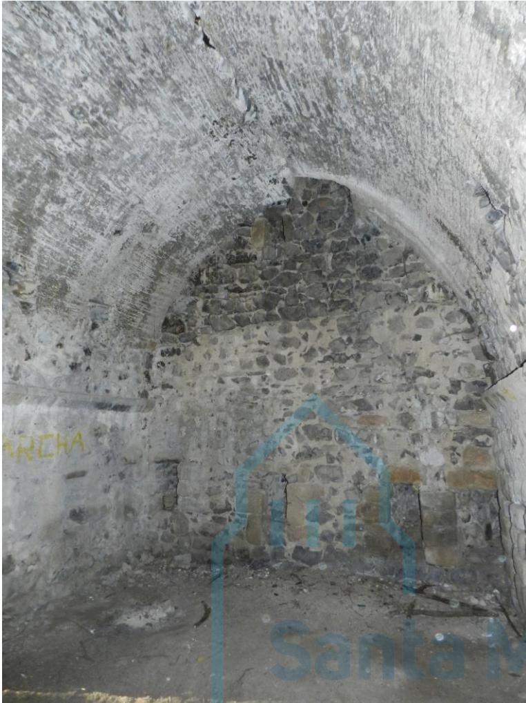
Interior del primer piso