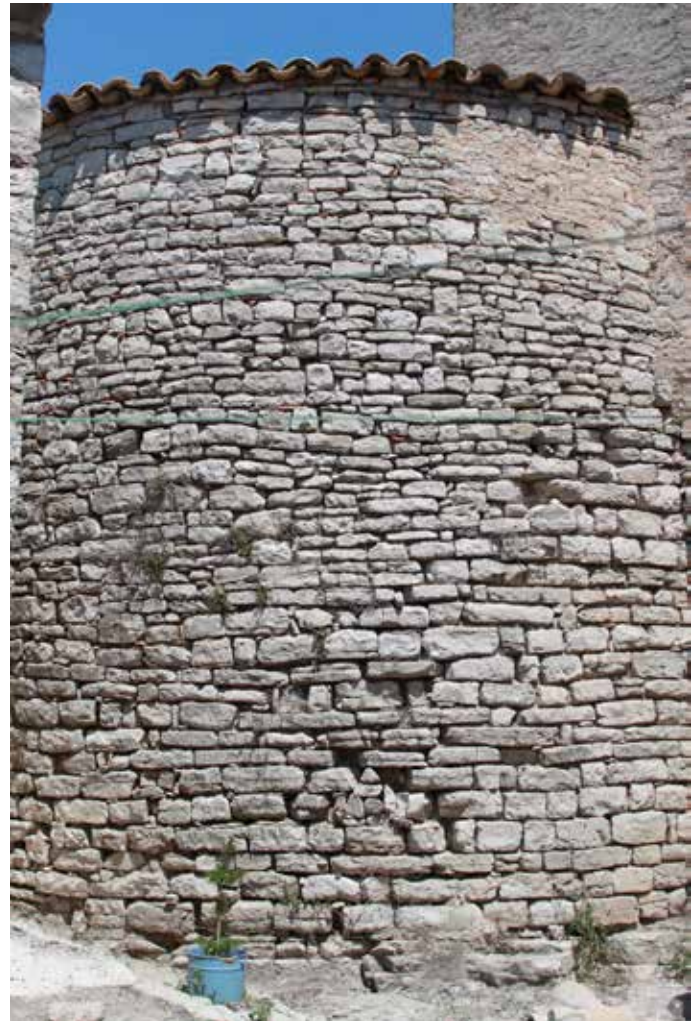
Restos de la torre

CASAS I NADAL, M., 1992, pp. 237-239; CASTELLS CATALANS, ELS, 1979, VI (I), pp. 616-617; CATALUNYA ROMÀNICA, 1984-1998, XXIV pp. 452-453; LLOBET I PORTELLA, J.M., 1992, pp. 39-41; MARKALAÍN I TORRES, J., GONZÁLEZ PÉREZ, J.R. y RUBIO RUÍZ, D., 1991, II, pp. 230-235; PÉREZ SERRA, M., 2008.