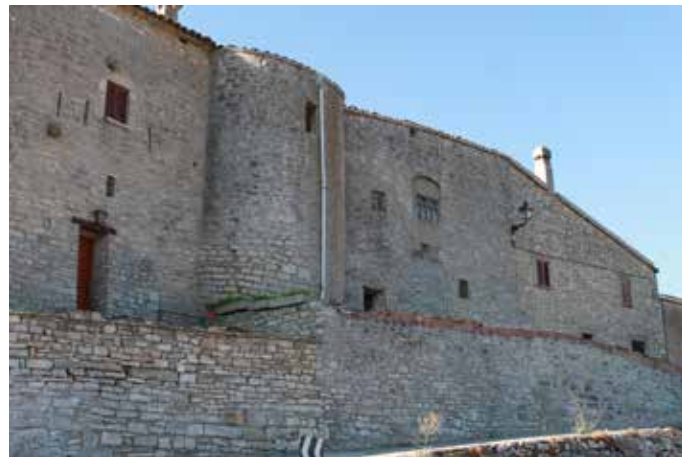
Restos de la torre

El castillo de La Tallada seguramente se erigió en el siglo XI, durante la repoblación y defensa de las tierras conquistadas