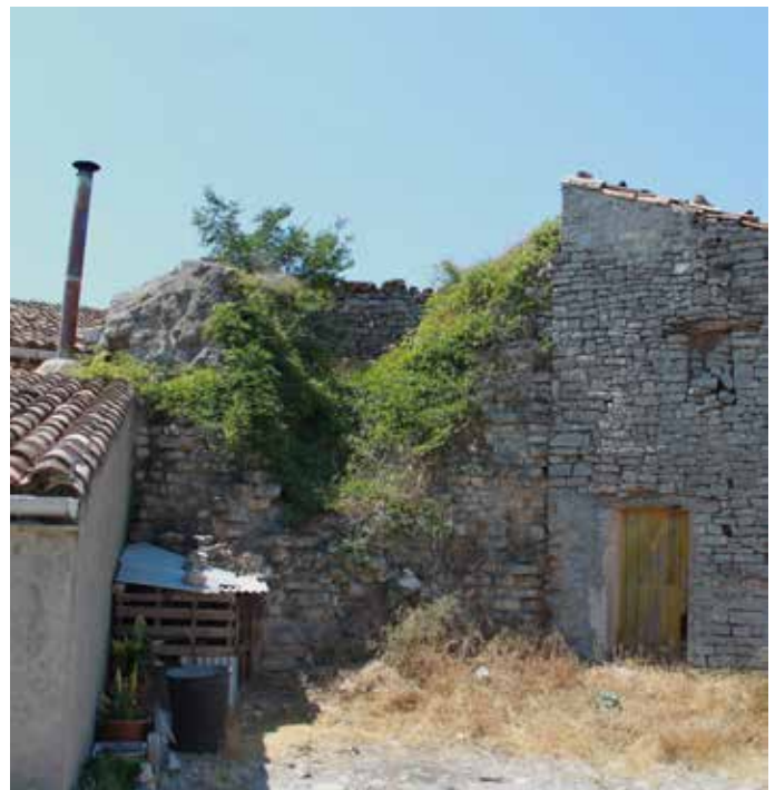
Restos de la torre