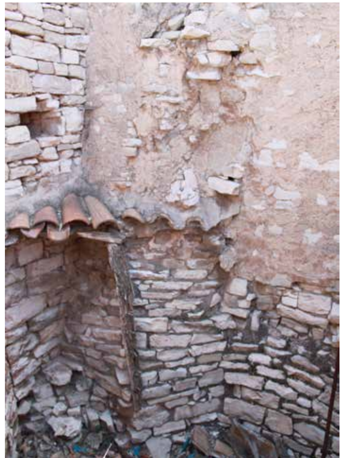
Restos de la torre

Desgraciadamente, del castillo de Amorós sólo se conservan unos restos del muro de 2 m de alto y 1 m de ancho, correspondientes a la antigua torre circular, ocultos en medio de las casas de la población, lo que obliga a entrar en una de las viviendas para poder contemplarlos. Están formados por un aparejo compuesto por sillarejo bastante irregular de tamaño desigual, y dispuesto en hiladas no uniformes.