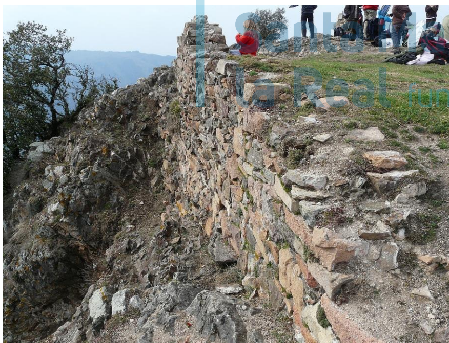
Vista general de los restos del castillo.

Hoy son pocos los restos románicos que se conservan del antiguo castillo, que quedó fuertemente afectado por el terremoto de 1427. Los elementos más antiguos son los restos de la base de una torre circular, y varios cimientos de muros que parecen fecharse en los siglos XI-XII. Existen, además, algunos restos de la capilla castral, Sant Miquel de Solterra, que está documentada desde 1240 y que, tras ser destruida por el terremoto de 1427, fue levantada de nuevo en el siglo XVI encima de las ruinas del castillo; se conservó en pie hasta 1910.