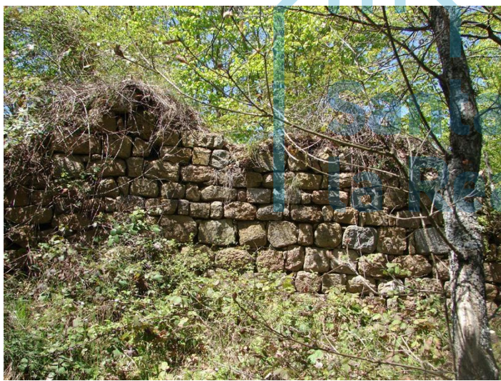
Vista de los restos del Castillo del Mas Carbó.

Actualmente los restos se encuentran en estado de abandono. Se pueden diferenciar dos habitaciones rectangulares, y una tercera estancia de la que se conserva solo un paño de muro. Posiblemente, el acceso estaba situado en la habitación central. Entre los años 1924 y 1926 se realizó una importante campaña arqueológica, impulsada por el entonces propietario del Mas Carbó y el arquitecto J. M. Pericas, que puso al descubierto la estructura alargada de la construcción, con varias aspilleras y rodeada por un foso, así como los restos de una escalera y de varios arcos en el piso inferior.