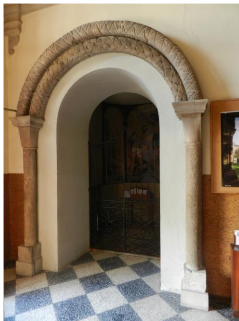
Restos de la antigua portada

Los fustes miden un 1,47 m de altura y son lisos, mientras que las arquivoltas presentan decoración vegetal y geométrica: la arquivolta inferior está decorada con cuerdas entrelazadas, y la superior con hojas superpuestas. Este tipo de ornato se ha relacionado con ejemplos similares en templos del obispado de Vic, como Santa Eugenia de Berga o Santa Maria de Vilalleons. La historiografía ha fechado el conjunto hacia finales del siglo XII.