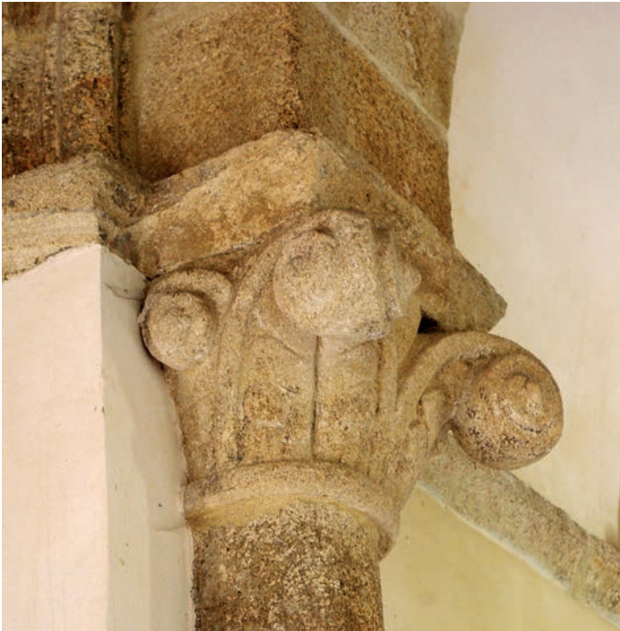
Capitel del arco triunfal

y en el norte, dos canecillos de figuración animal: un par de cabezas con cornamenta.