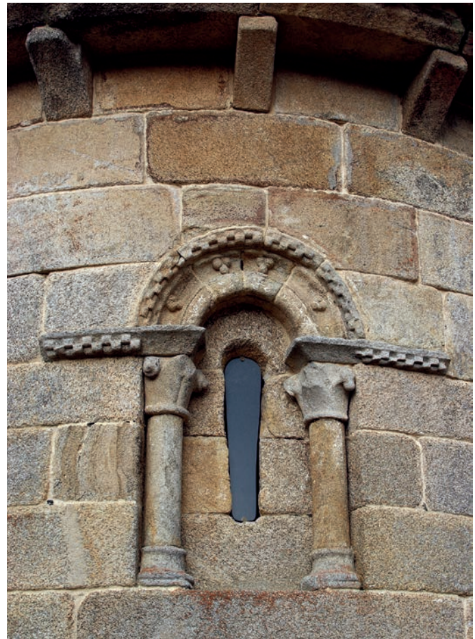
Ventana del ábside

En los aleros de la cabecera se desarrollan cobijas en bisel sobre canecillos lisos y cortados en oblicuo. Se conservan en la zona más occidental de los aleros de la nave, en el sur