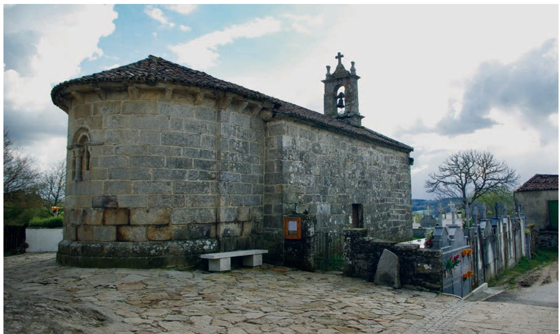
Vista desde el lado noreste

En la transición de bóvedas de la cabecera se sitúa un arco fajón, de medio punto, achatado en su parte superior, y sección prismática. Se apea, a través de cimacios en bisel, en columnas entregas sobre un banco corrido. Los soportes se organizan en basas áticas, fustes lisos y capiteles con decoración vegetal. Carnosas hojas lanceoladas separan sus puntas