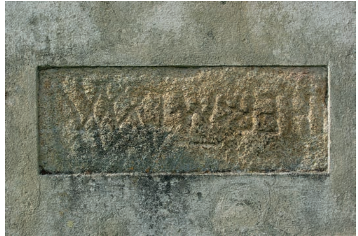
Inscripción de 1192