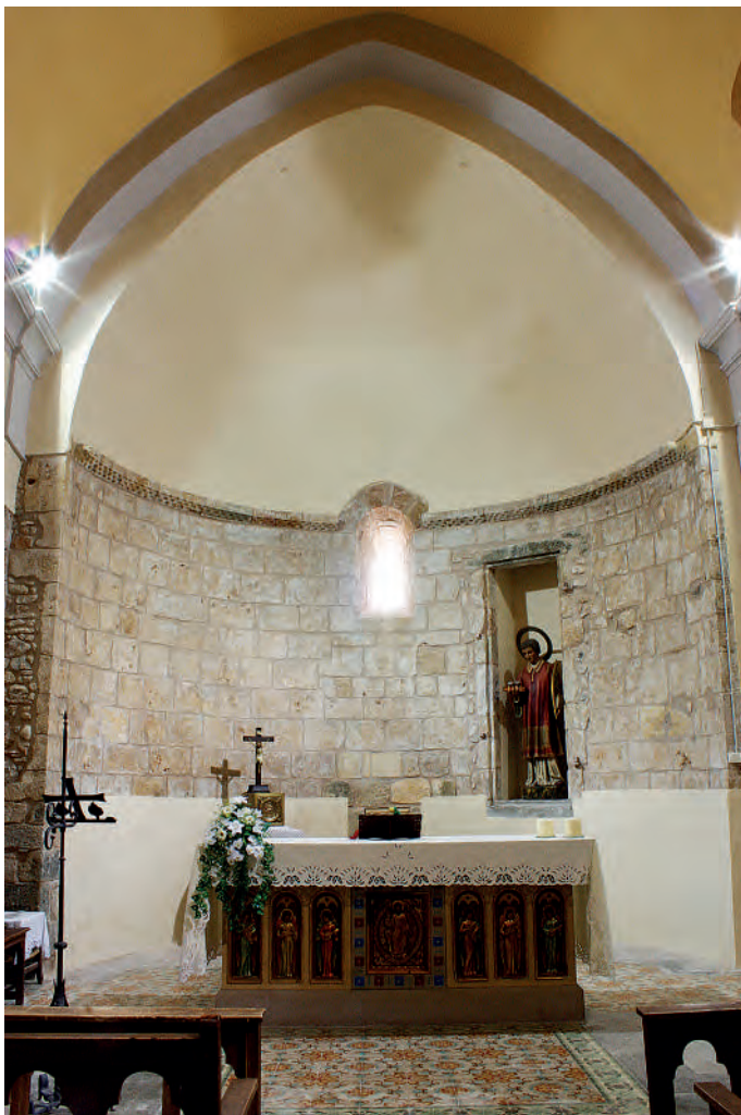
Interior de l'absis

obertures originals. Es tracta de tres finestres, una situada a l'absis, una altra al mur sud (actualment tapiada) i l'última al frontis. Totes presenten doble esqueixada i arc de mig punt.