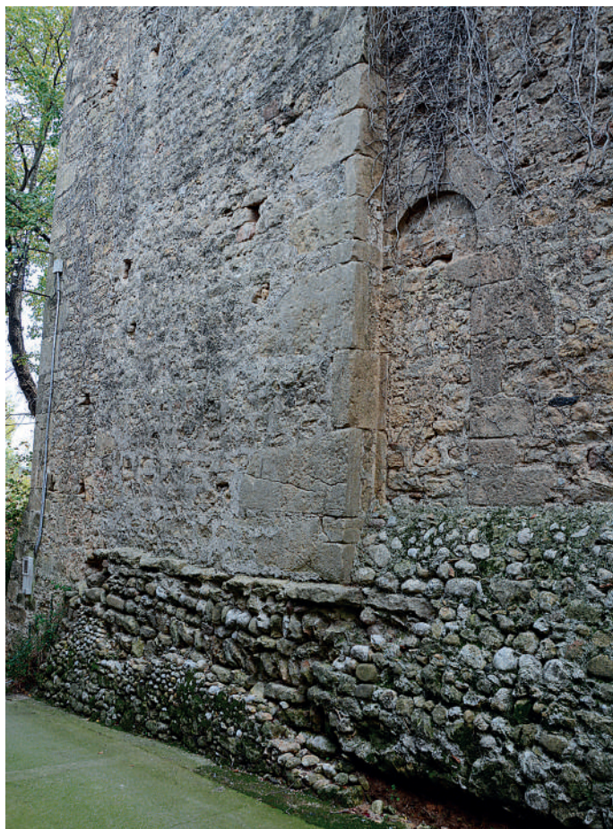
Vestigis de l'església primitiva

poble de Vilademuls, per la carretera GIV-5141. El temple es documenta per primera vegada l'any 1202 com Sancti Julianii de Gallinariis . En el segle XIII apareix citat diverses vegades a les Rationes decimarum . El 1227 percebien els delmes del temple els vescomtes de Rocabertí, senyors de Vilademuls. Un segle després, l'any 1320, l'església de Sant Julià es va segreguar de la parròquia de Parets d'Empordà, de la qual depenia. En el segle XVIII se'n van reformar la nau, la capçalera i el campanar; les inscripcions gravades que recorden l'obra són nombroses, com ara la del 1780 situada a la façana occidental.