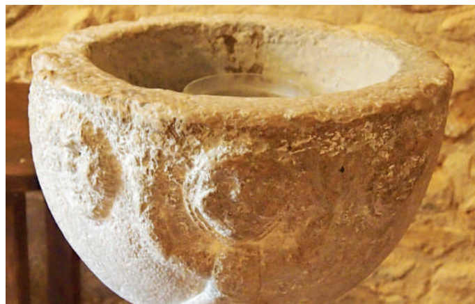
Detall de la pica d'aigua beneïta

D'altra banda, a l'interior d'aquest temple es conserva una pica d'aigua beneïta que probablement va pertànyer a l'església romànica primitiva. La peça presenta figures amb