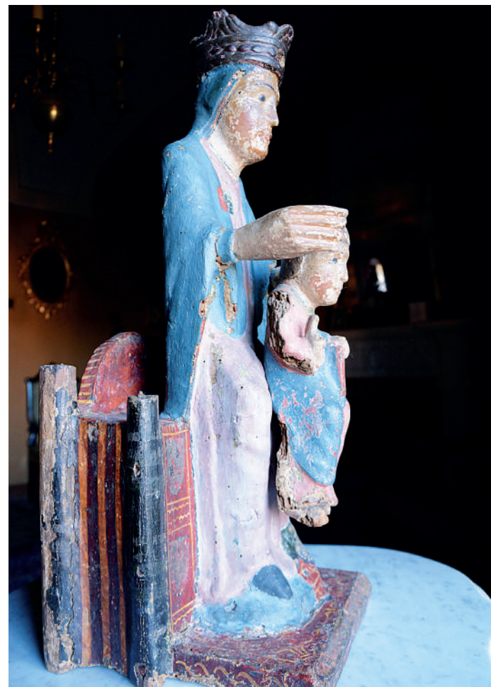
Vista lateral de la imatge

La peça va ser lleugerament restaurada l'any 1985 amb motiu de la seva inclusió en una exposició temporal exhibida al Museu d'Art de Girona. Aquesta restauració va posar al descobert una policromia anterior a la que s'observa actualment, que probablement és l'original. Aquesta policromia es pot veure sobretot als peus de la Verge, on es dibuixa una sanefa daurada sobre un fons vermell, i seria tapada a posteriori per una policromia de to blau fosc, com a continuació del color de la túnica. Sembla que aviat es durà a terme una restauració més exhaustiva de la peça, per analitzar millor l'abast de la policromia original conservada.