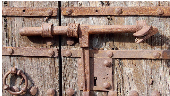
Ferramentes de la porta

AA.VV., 2005, pp. 624-625; BADIA I HOMS, J. i OLAVARRIETA I SANTAFÉ, J., 1991, p. 190; CATALUNYA ROMÀNICA, 1984-1998, V, pp. 470-471.