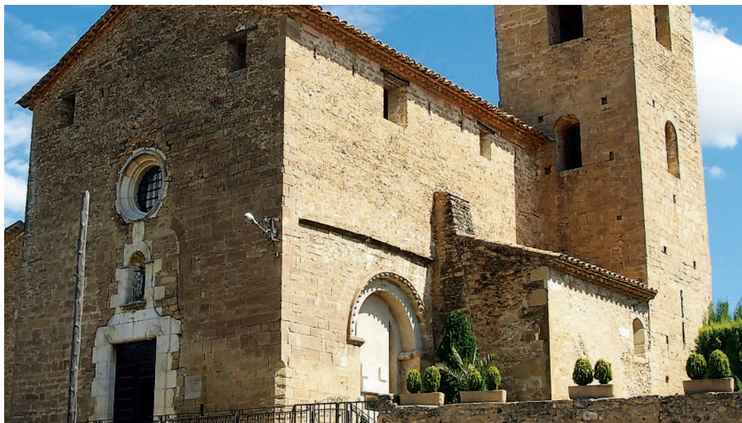
Vista de l'església amb restes del mur romànic

la qual cosa se'n va celebrar una nova consagració el 1689, i per aquest motiu l'estil actualment predominant a l'edifici és el barroc.