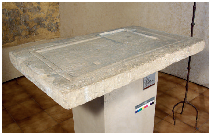
Ara d'altar (Museu d'Art de Girona, núm. reg. MDG0129. Tots els drets reservats de Girona).

Procedent de Sant Pere de Juïgues, al mateix Museu d'Art de Girona es conserva en perfecte estat una gran ara d'altar (núm. reg. MDG0129), amb unes mesures de 8 x 116 x 71 cm. És rectangular, feta amb pedra calcària, i mostra un petit relleu rectangular a la cara superior. Per exhibir-la en