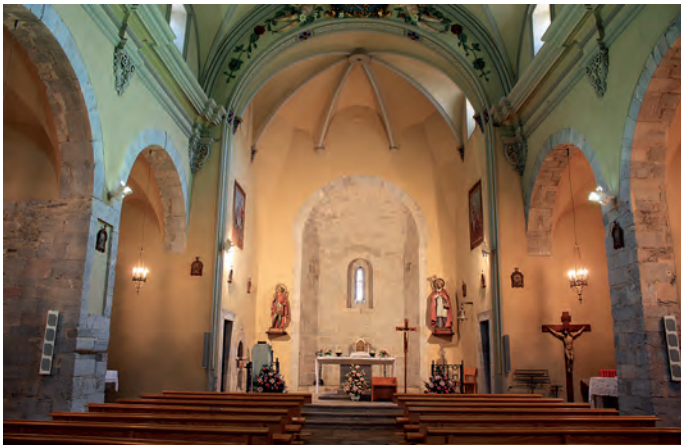
Vista de l'interior

les restes romàniques i la restauració de les pintures murals modernes.