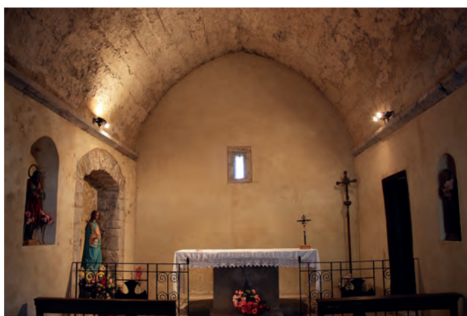
Interior cap a l'est

A aquest mateix moment deuen correspondre els canvis que es van fer a la façana oest. Aquí l'alteració en la disposició dels carreus també permet deduir una modificació de la configuració inicial de la façana: en concret, el morter sobre la porta permet resseguir el perfil del que devia ser un arc de descàrrega de mig punt, substituït posteriorment per l'accés adovellat actual. La porta, de doble batent, és precisament la que conté els elements més destacats de Santa Llúcia: el forrellat, el pany i les ferramentes que la decoren, tots d'origen romànic. Es tracta de diverses peces de ferro forjat, la disposició i configuració de les quals responen a la tipologia més corrent en la decoració de les portes ferrades del Ripollès (vegeu, per exemple, el cas de les esglésies de Sant Esteve de Llanars i de Sant Cristòfol de Toses), en la variant més simple. Així, trobem un pany creat a partir d'una caixa quadrada, els costats de la qual es prolonguen fins a donar-los forma còncava, un forrellat constituït per un pasador cilíndric unit pel centre a una maneta de ferro plana, un tirador d'anella i fins a vuit cintes de ferro que uneixen