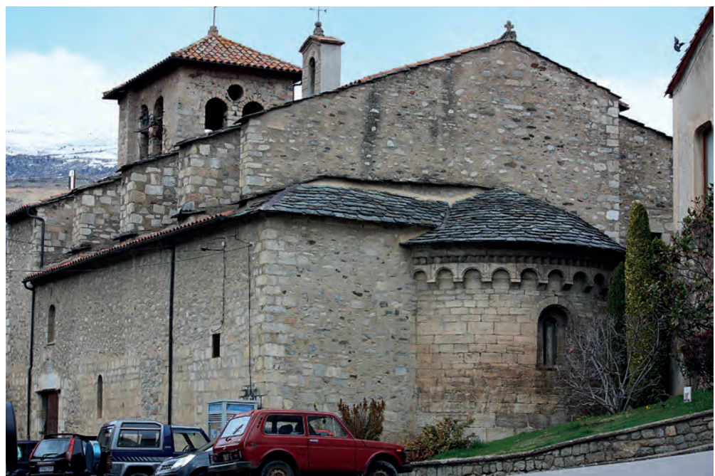
Vista de la capçalera

el barroc– ben allunyats tant en el temps com en la concepció estètica. Durant la dècada del 1990 s'hi van dur a terme alguns treballs de restauració que van consistir, fonamentalment, en la consolidació de les estructures, la recuperació de