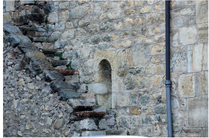
Finestra a la façana sud, al costat de l'escala d'accés al campanar

Aquest document ha servit a la historiografia per acotar la cronologia de l'obra romànica –que segons les seves característiques tipològiques i constructives, que es detallaran a continuació, s'ha de situar a la segona meitat del segle XII–, en entendre que la cessió es devia produir després de la