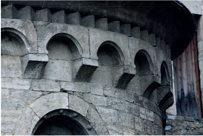
Detall de l'absis romànic