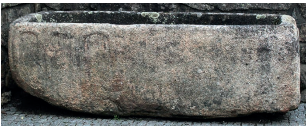
Duas vistas de uma das arcas tumulares