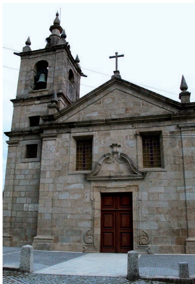
Alçado oeste. A inscrição localiza-se à direita do portal

Em 1320, segundo o Catálogo das igrejas, comendas e mosteiros do reino, a igreja de São Salvador de Cervães,