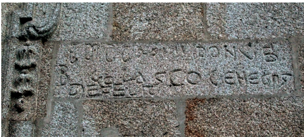
Fachada oeste. Inscrição de 1186